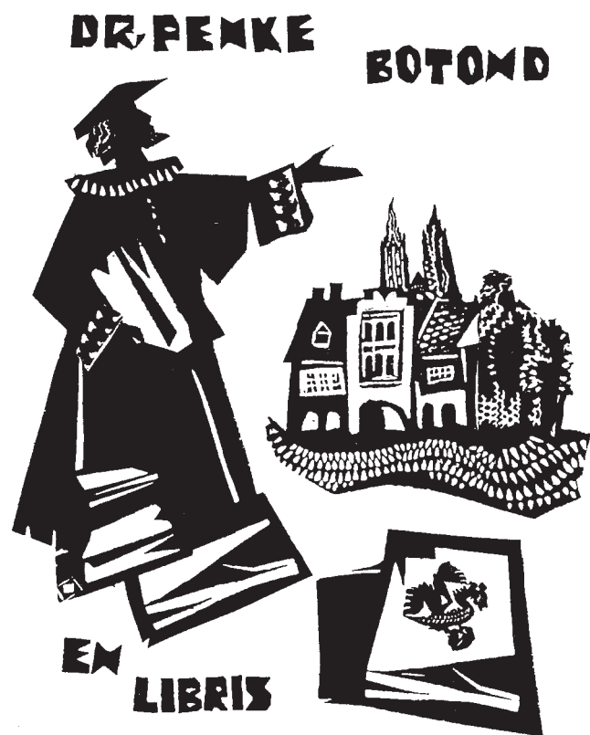
Kopasz Márta linómetszete, X3 (2001), 100×85

reten fekete színnel, egységes szerkezetbe foglaltan, poétikusan kell megfogalmazni a megrendelő világlátásában megjelenő kívánságát úgy, hogy a művész sajátos stílusának jegyei is maradéktalanul érvényesüljenek. Ettől nagyon izgalmas a könyvjegy készítése és nehéz a benne lévő üzenet érvényesülésének a biztosítása. Csak a legnagyobbak képesek ennek a bonyolult feladatnak maradéktalanul eleget tenni, és ezeket a kisméretű remekműveket létrehozni.