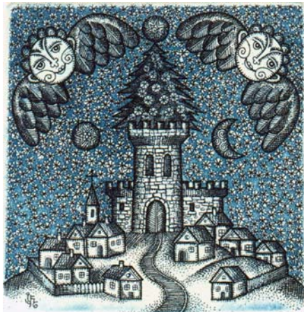
íj. Feszt László rézkarca, C3 (1996), 60×60

állatalakok jelennek meg, totem-oszlopok, ősi szimbólumok, különféle vallások és kultúrák fő alakjai. A világ egészét magukba sűrítő mandalák, törzsi tetoválásokat idéző elvont formák, buddhák, lótuszvirágok, mitológiai alakok és így tovább. És mi értjük őket, meg tudjuk fejteni a látványt, ami élénk táru. Ennek valószínűleg több mellett két fő oka is van. Az egyik, hogy Feszt a saját képére formálja mindezeket: mai lélekkel, mai szemmel és kézzel úgy formálja őket, hogy bele is visz valamit mindebből, új tartalmakkal tölti fel az ősit. Jó példa erre a Kentaur alakja: alsó fele már nem az állati rész, ez a lény, ez a kentaur már saját kreálmányaira épül, ezekre épít, ezek képezik léte alapját. A keresztény alap-motívumokat egyszerre tárja élénk jelekként, alap-formákként a művész, és ugyanakkor ki tudjuk olvasni az elmesélhető dimenziót is, a Holdsarlón álló Mária, vagy a Sárkányölő Szent György esetében is. A képekkel való találkozásakor a ráismerés egy másik fajtájával is találkozhatunk, amely a szimbólumok, ösképek, mondhatni, archetípusok működésének köszönhető. Egy igen neves művészettörténész, Ernst Gombrich szerint a