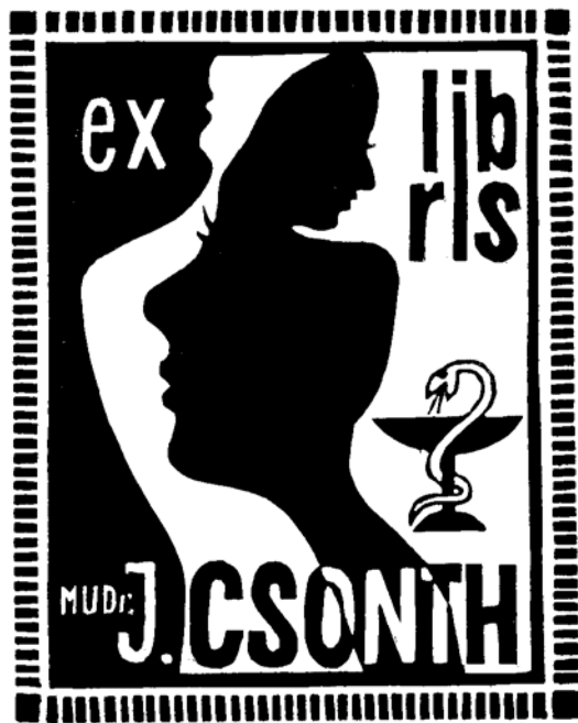
Viktor Chrenko (CZ) linómetszete, X3 (1979), 85×67