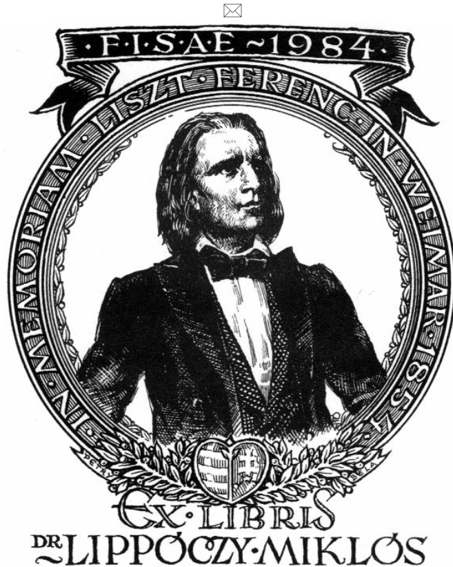
Petry Béla grafikája, P1 (1984), 115×95

zölt műveket elemezve a szerző azokon „álomszerű, mesés lényeket lát, kik összekötik a földi és égi világot”. A montázs-technikával kialakított szürrealista világ a művésznek sikeres jövőt ígér.