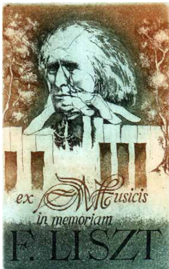
Bálint Ferenc rézkarca, C3/C5 (1987), 115×73