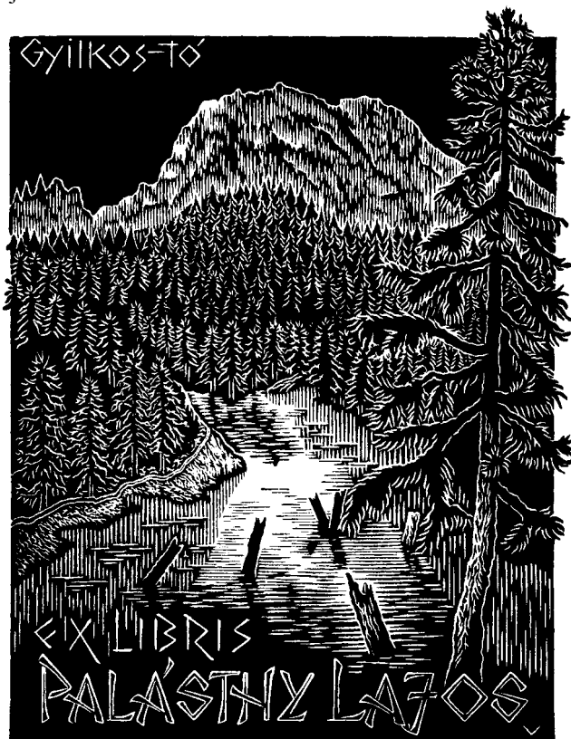
Vecserka Zsolt fametszete, X1 (2010), 108×84