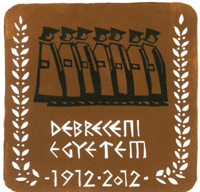
Salamon Árpád linómetszete, X3/2 (2012), 130×130

A Debreceni Egyetem rektorának díját Vincze László művész érdemelte ki, elsősorban a kollégium és Nagytemplom egységének, erejének ábrázolásával a debreceni kezdeteknek, a gyökereknek a máig ható kétségbe nem vonható jelentőségét hangsúlyozva, a tőle megszokott vonalas metszőtechnikát alkalmazva.