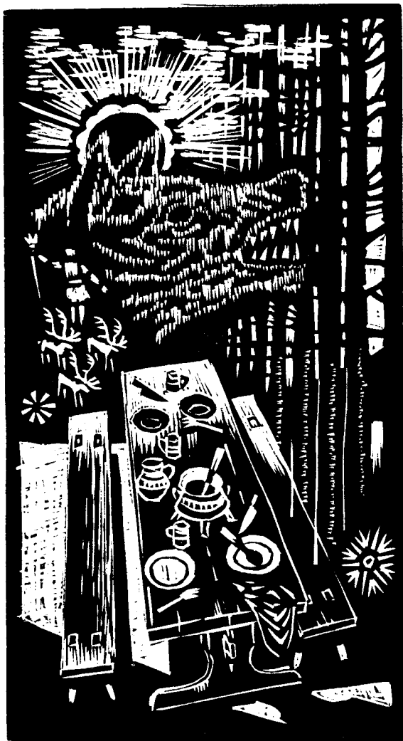
Jurida Károly linómetszete, X3, 135×75