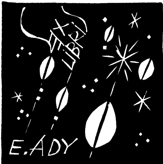
Salamon Árpád linómetszete, X3, 70×70