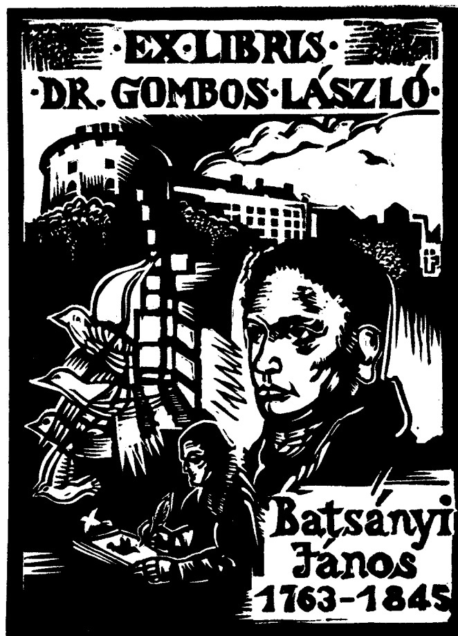
Ürmös Péter linómetszete, X3 (2011), 120×87

Egy cikk Józsa Judit Párizsban élő grafikusművészt mutatja be.