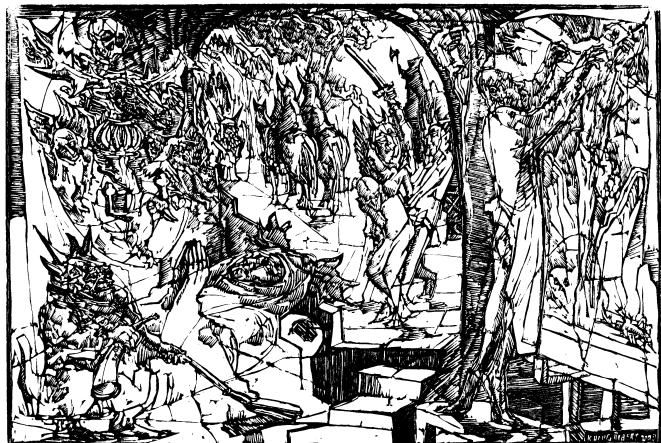
König Róbert linómetszete, X3 (2003), 350×500 mm

A gonosz nem csak bitófa ágán lóg Közöttünk házal nap mint nap Követei hegyes szarvú szörnyecskék minden ajtón bezörögetnek Néha békésen püspökök áldást osztó keze mögé rejtőznek máskor megsebzett vadkan dühébe Az Ember ingtag Ha lelke megtörik és testét felnégyelik tort ülnek a pokol démonai Kétkedőket kereszték árnyékában is az ördög kísért