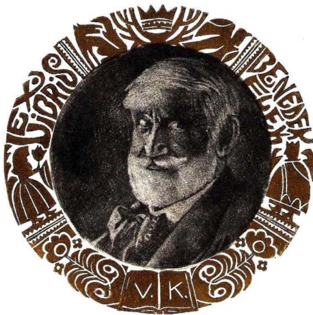
Börcsök Attila grafikája, X3/C7, 2012