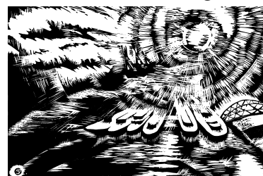
Juhász Miklós linómetszete, X3