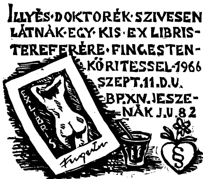
Semsey Andor fametszete, X2, op. 35 (1966), 90×90

Gyűjteménye pontos számadatai nem ismertek, kb. 10-15 ezer darab körül lehetett. Ahogy írja: „Gyűjteményem rendezéséig negyvennégy év alatt nem tudtam eljutni. A grafikák megszámlálásához sem időm, sem erőm nincsen.” 6