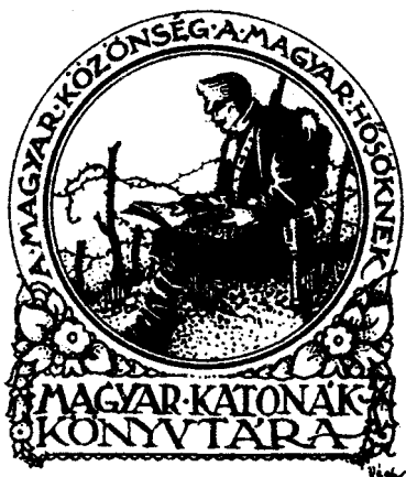
Véghe Gusztáv grafikája, P1, 55×47