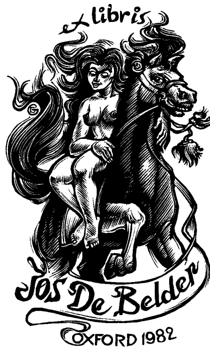
Gerard Gaudaen fametszete, X2 (1982), 90×55