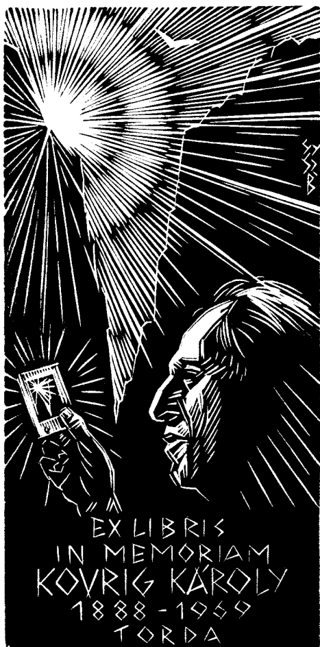
Gy. Szabó Béla fametszete, XI, 125×60