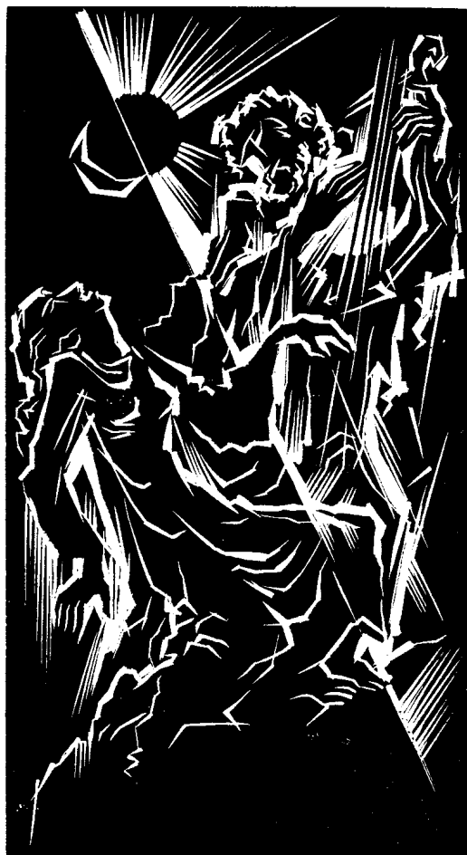
Imets László fametszete, X2, 125×65