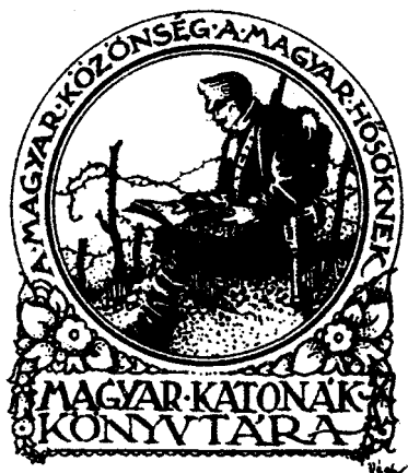
Véghe Gusztáv grafikája, P1, 55×47