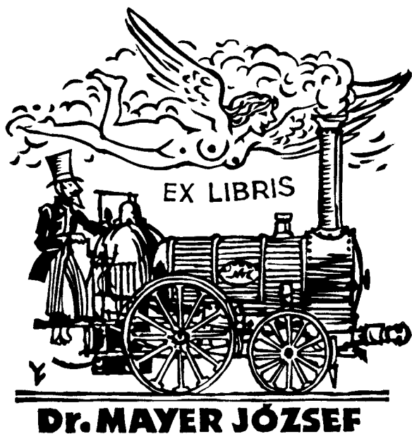
Vincze László linómetszete, X3 (1997), 80×75