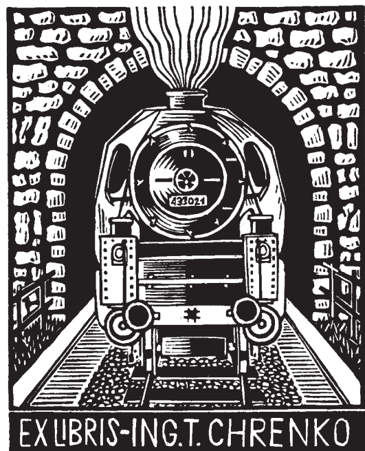
Viktor Chrenko (cseh) linómetszete, X3 (1985), 86×68