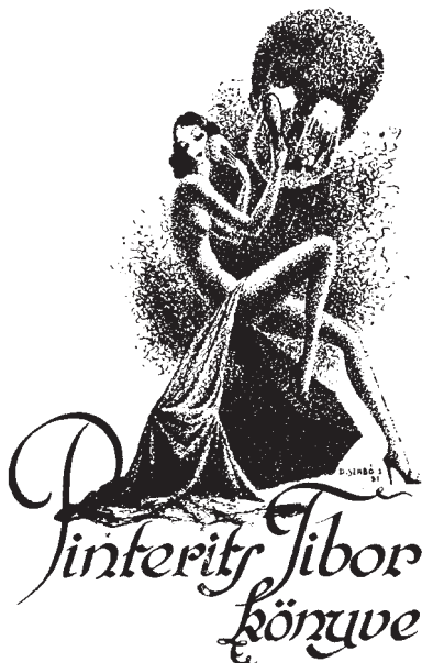
D. Szabó István grafikája, P1 (1931), 80×50

2017. június 23-án megrendezésre került Vasné dr. Tóth Kornélia Ex libris és képkultúra. Modern magyar ex librisek c. képes albumának harmadik könyvbemutatója a Kazinczy Ferenc Múzeumban, Sátoraljaújhelyen. A 4. nyelvésztábor keretében, az Anyanyelvpolók Szövetsége és a Magyar Nyelv és Kultúra Nemzetközi Társasága által szervezett rendezvényen