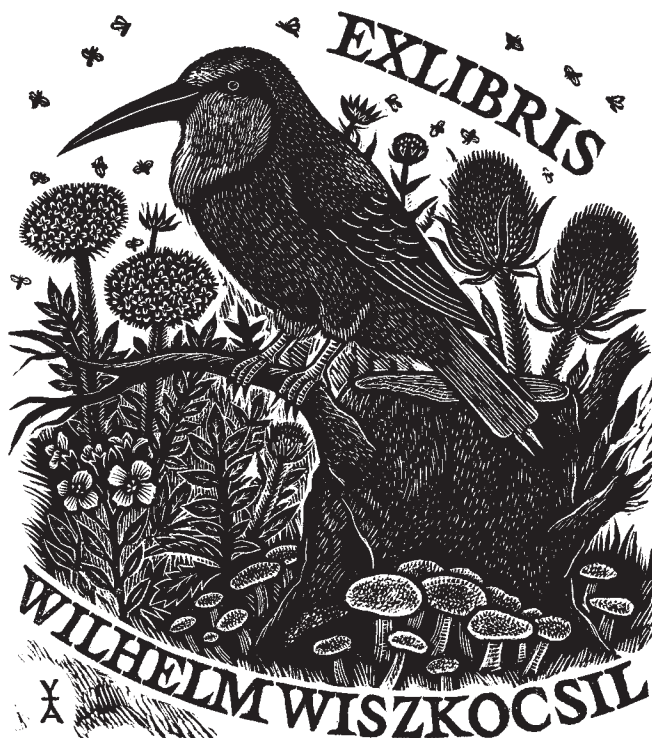
Antoon Vermeylen grafikája, 95×85

Nordisk Exlibris Tidsskrift 2017/2. A dán egyesület sajnálkozik azon, hogy nincs grafikusuk, aki ex libriseket készítene. Az egykori fénykorból Ebba Holm (1889-1967) művészetét mutatják be.