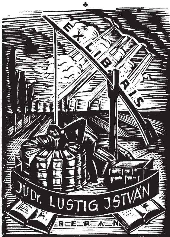
Jaro Beran (cseh) fametszete, X2, 100×75

A kiadványok között fontosak a cseh művészek alkotásjegyzékei.