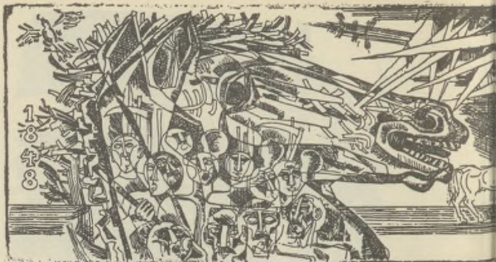
JÓZSA János rézkarc C3

A kitűzött díjakon Deák Ferenc (I. díj), Perei Zoltán (II. díj) és Papp György (III. díj) osztoszkodnak. Deák Ferencben egy, a műfajban később kiteljesedett alkotót köszönhetünk, akiben a jó ex libris művész minden adottsága fellelhető; egyéni képszerűségével, technikai bravurjaival, szimbolikájának filozófikus mélységével joggal magasodik a többi alkotó fölé; biztosak vagyunk benne, hogy nem kis szerepe lesz a magyar ex libris művészet megújításában. Perei Zoltán tehetségéről eddig kevesen vettek tudomást, a megismerés magányába zárva alkotta egyéni metszőtechnikával kivitelezett, egyszerűségükben is erőteljes, duzzadó, konvenciómentes lapjait; reméljük, hogy a ceglédi díj nyomán a művészek után a gyűjtőknek is ráirányul a figyelmük és lapjai ott lesznek minden ex libris gyűjteményben. Papp György harmadik díja arra figyelmeztet, hogy Szeged értékes kisgrafikai hagyományai ma is élnek és számíthatunk rájuk.