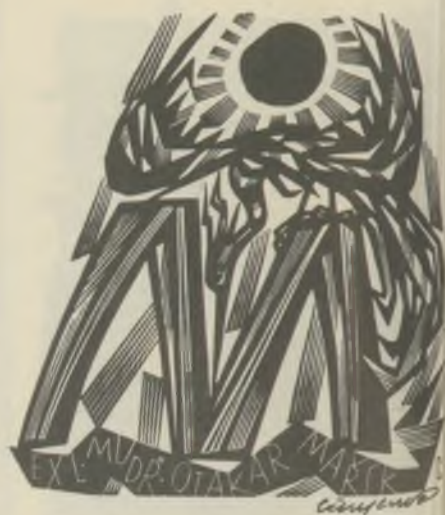
V. CINYBULK fametszete X2

A keletnémet Der Morgen 1973. december 15-i számában jelent meg K.H. Anger "Exlibris. An Neujahrs-graphiken denken" című írása, amely Bordás Ferenc Galambos Ferenc részére készített 1972. évi újévi lapját elemzi, a lap reprodukciója kíséretében.