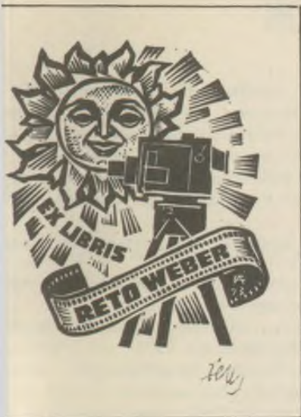
Antal fametszete X2