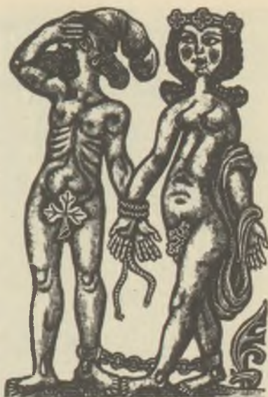
JOHANNES-SOVEREIN EX LIBRIS