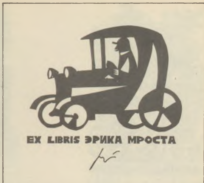
G. RATNER műanyagmetszete X6

A Typographia 1973. évi 2. számában Nagy Zoltán Munkácsy-díjas művészünköt mutatja be "A szavak művésze. Aranykéz - alkotás" címmel, három fénykép kíséretében.