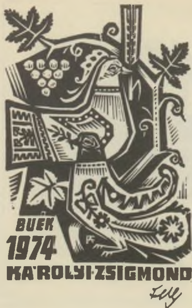
FERY Antal fametszete X2