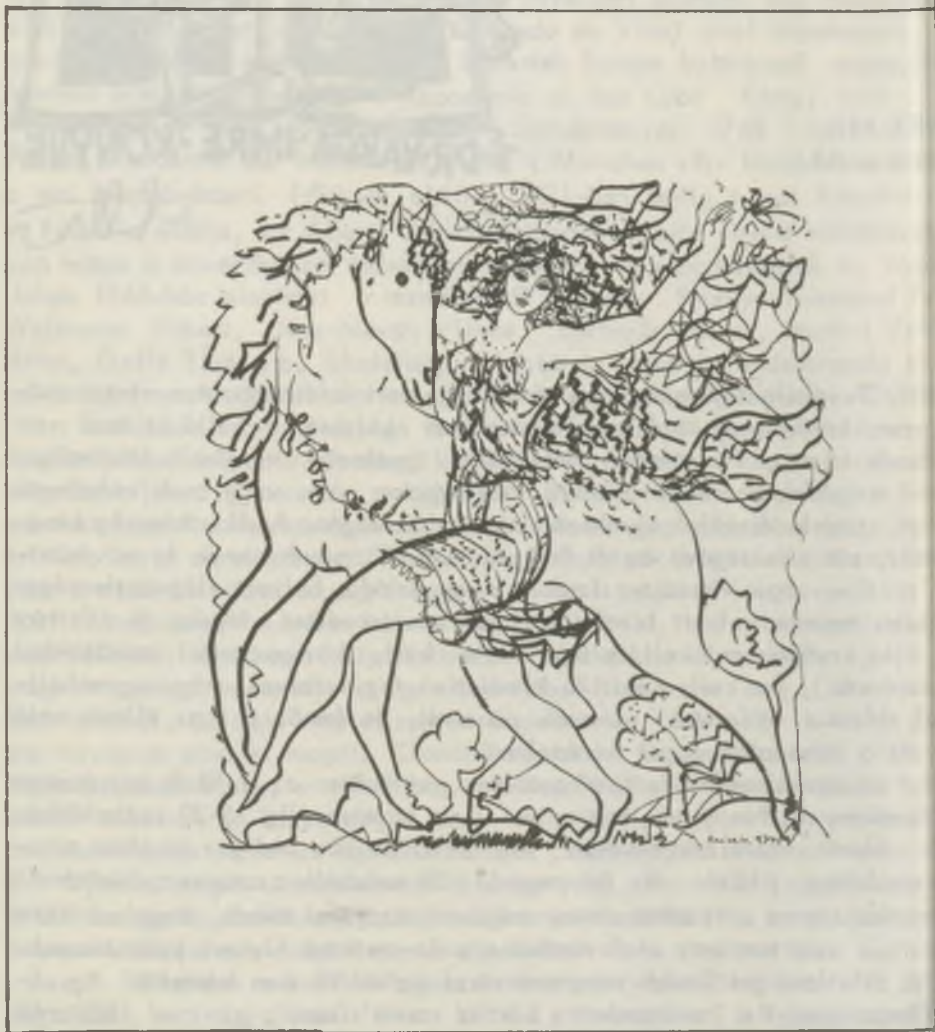
REICH Károly ecsetrajza — A KÉPCSARNOK által rendezett Országos Grafikai Hét (1974.IX.26-X.5) plakátjain és meghívóin sokszorosított