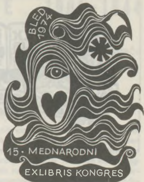
JANOUSEK fametszete X2/2

m. Vrsic csucsra. A hajtűkanyarok és az út melletti meredek szakadékok a nők közül többen rosszul lettek. A csucsról minden irányba nézve 2600 méteres hegyeket láttunk és nagyon fáztunk a hideg szélben és éles kövön. A csucsról lemenet a másik oldalon is 40-45 hajtűkanyart tettünk. Bizony minket, akik nem szoktunk hozzá ezekhez a veszélyes utakhoz szorongatott egy kicsit. A völgybe érve tizórait kaptunk, amit az egyik adományával 700 üveg sörrel öntöztünk meg.