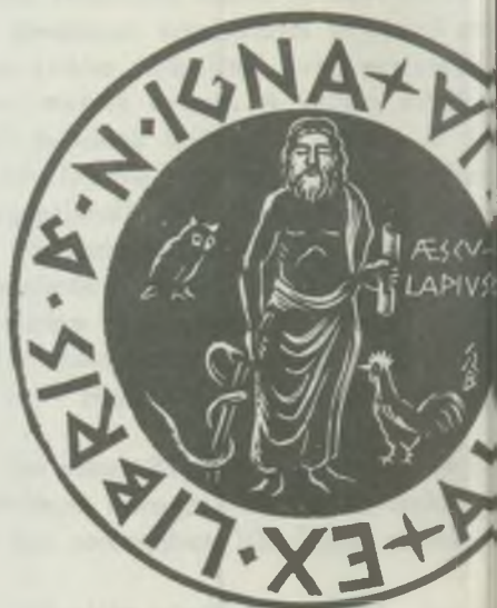
GY.SZABŐ Béla fametszetei X2 (1936, 1935)