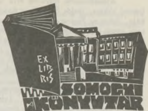
SZEKERES Ferenc linómetszetei X3

tszítve, feldolgozatlanul heverték raktárunk mélyén.