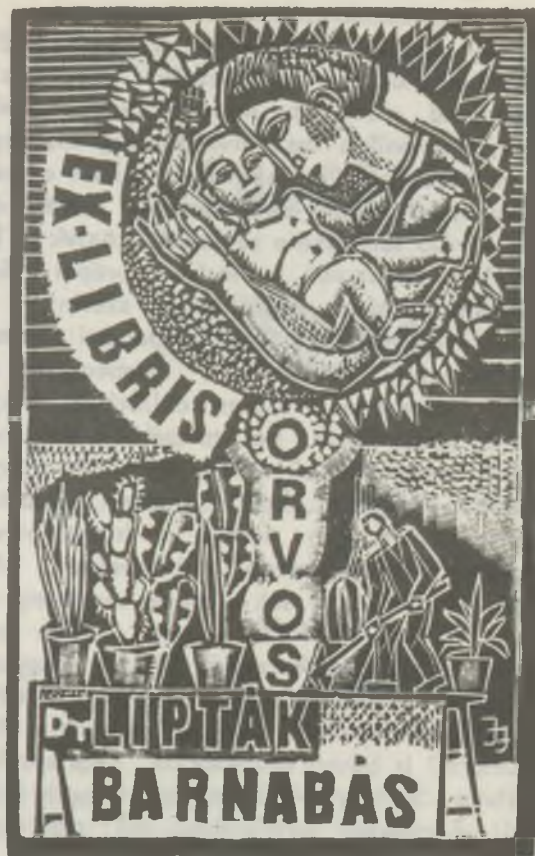
A János fametszete X2

CONYI Károly festszete X2 és klisérajza P1