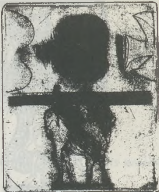
A madár körül I. Püspöky 75.