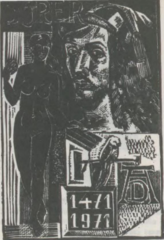
JÓZSA János fametszet

Mint már említettem, az arcmás készülhet hiteles dokumentumok, korabeli ábrázolások alapján, de lehet képzeletbeli is. A portré kapcsolódhat az adott személy életművének valamely alkotásához, így egy író arcképe valamilyen művének jelenetéhez, művészé egy képéhez, szobrához, történelmi személyé valamely városhoz vagy eseményhez. Évfordulók alkalmával van a leggyakrabban indíték az ilyen ábrázolásra, és a kifejezetten alkalmi grafika mellett kívül egy-egy évforduló számos portrés exlibris megszületését is elősegíti. Szovjetunió ex libris-művészei gyakran ábrázolják Lenint, de magyar példát is tudunk felhozni. Itt említem meg, hogy a minszki Jevgenyij Tyihonov exlibrissein a magyar kultúra és történelem számos jeles alakjával találkozunk.