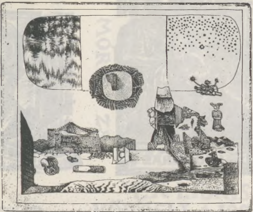
Zsokőnyv - illusztráció 'VII'