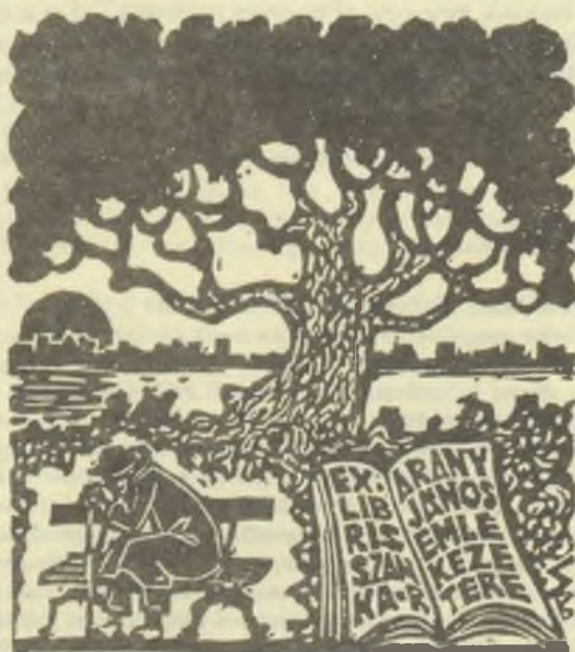
Stettner Béla linómetszetei, X3