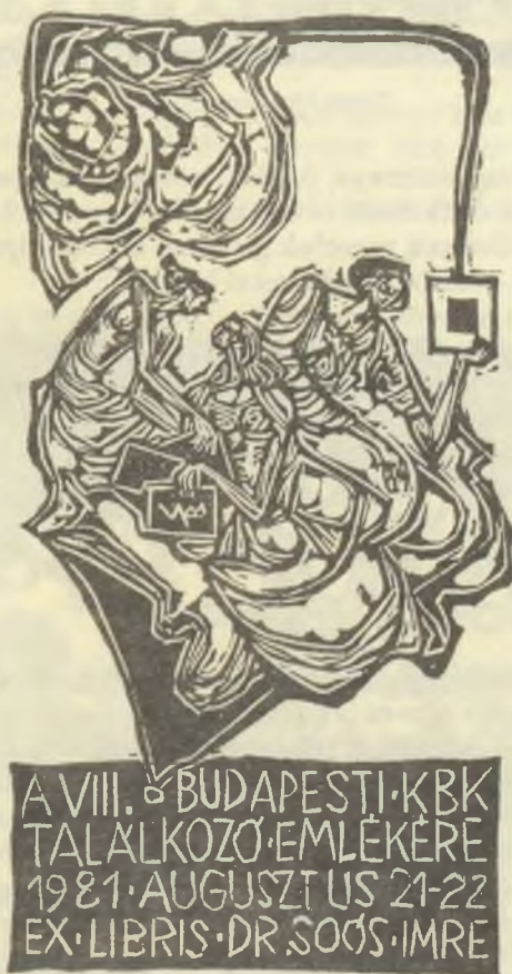
Stettner Béla linómetszetei, X3