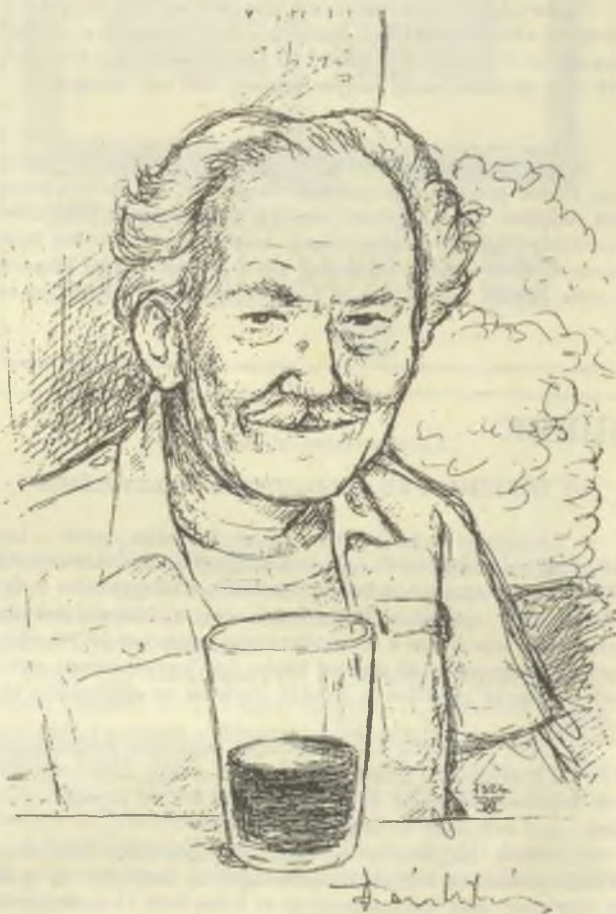
Várkonyi Károly rajza