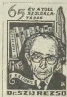
JÓKAI MÓR VÁROSI KÖNYVTÁR PÁPA, 1998