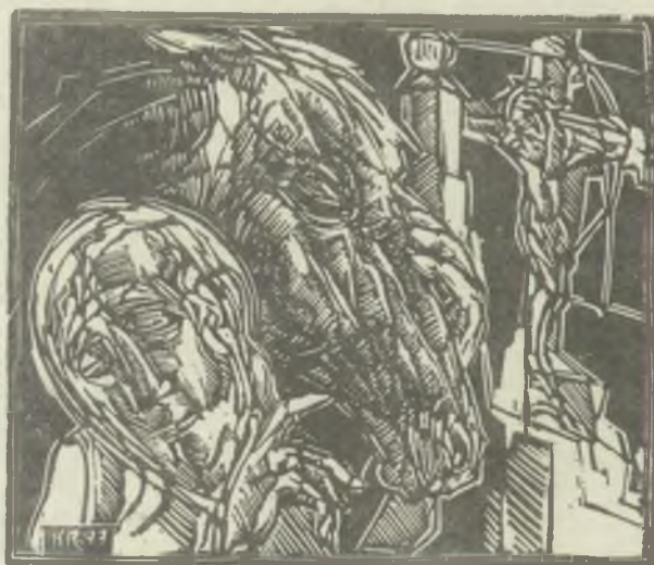
König Róbert linómetszetei, x3