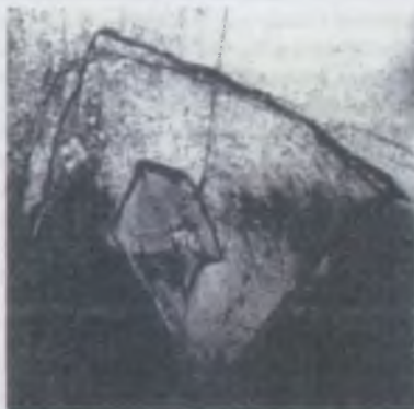
Szőke György: Inga. (Mezolintó)

A hajdan „kincses”-nek mondott városban, Kolozsvárott a Bánffy palotában székelő Kolozsvári Szépművészeti Múzeum földszinti termében 1999. szeptember 8–30 között visszhangos sikerű Nemzetközi Grafikai fesztivál zajlott le, ahol is 47 ország 324 grafikusművésének 736 ragyogó munkáját csodálhatta meg a vonalzsépségek iránt fogé-