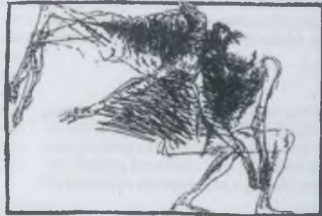
Bárdócz Lajos tollrajza