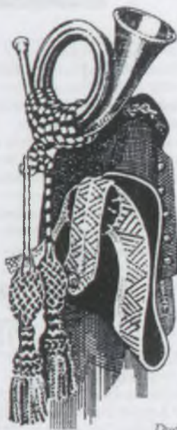
Dudás László rézmetszete (C2)