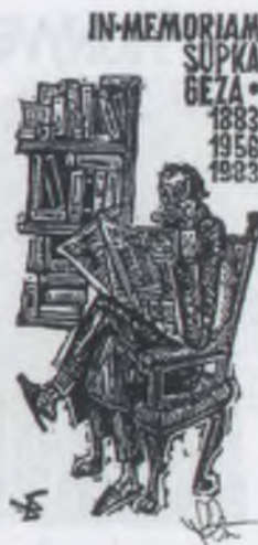
Stettner Béla linómetszete (X3)