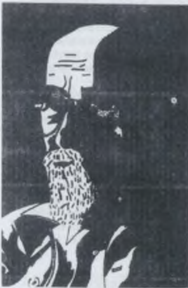
Takács Gábor fametszete (X2)