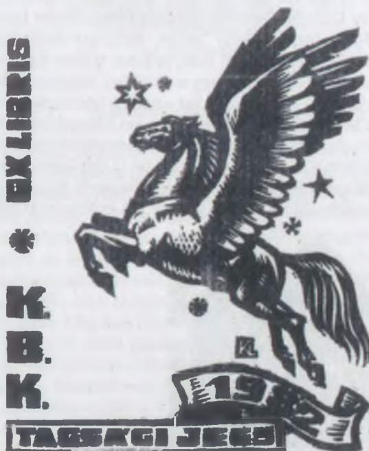
Kékesi László fametszete (X2)

A II. Világháborút követő idők nem kedveztek a polgári egyesületeknek, olyannyira nem, hogy Szviridov tábornagy, a magyarországi Szövetséges Ellenőrző Bizottság elnöke „óhajára” eltöröltek valamennyi civil egyesületet, így egyik napról a másikra megszűnt létezni a MEGE és az Ajtósi Dürer Céh is. Az egykori tagok közül volt, aki a háború borzalmainak lett áldo-