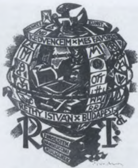
Drahos István fametszete

mint hogy 1970-ben Budapest adott otthont a XIII. Nemzetközi Kongresszusnak, melynek rendezési jogát 1968-ban Comóban ítelték oda a magyar fővárosnak. Ekkoriban nevezte el Magyarországot a jeles elzászi professzor, Paul Pfister „Ex libris land”-nak.