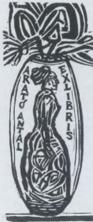
Perei Zoltán fametszete (XI)

Tanulmányai végeztével önképzésképpen évekig Rembrandt és Gova halhatatlan életművének igézeté-