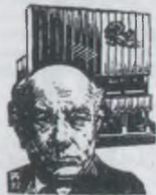
AZ ILLYÉS GYULA MAGYAR IRODALMI KLUB AJANDEKA

A kiállítások jól kapcsolódtak a könyvheti rendezvényekhez, s minden bizonnyal tanulságos látóvalokat kínáltak az intézmények által szervezett író-olvasó találkozók, könyvbemutatók látogatóinak is.