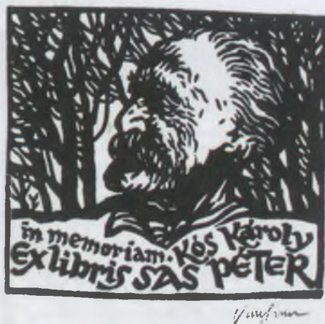
Vincze László linómetszete (X3)