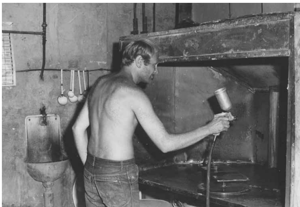
Bonyhád, zománcgyár, 1970