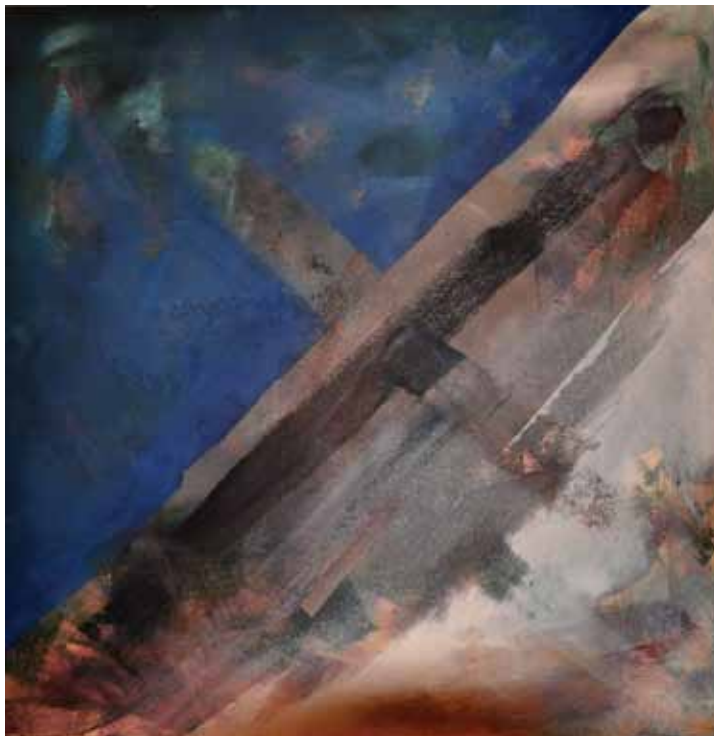
Tengeri horizont , 1979. akril, v., 100 x 100 cm