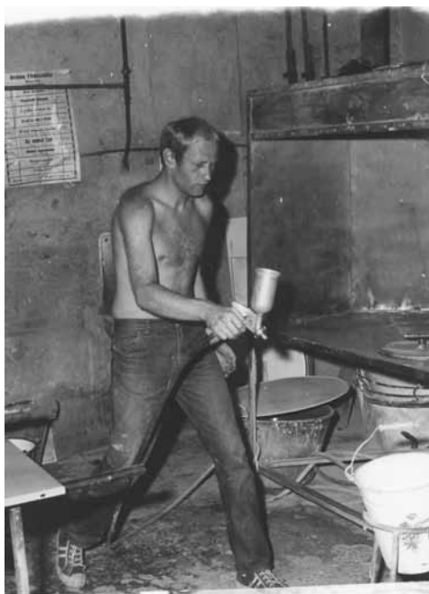
Bonyhád, zománcgyár, 1970