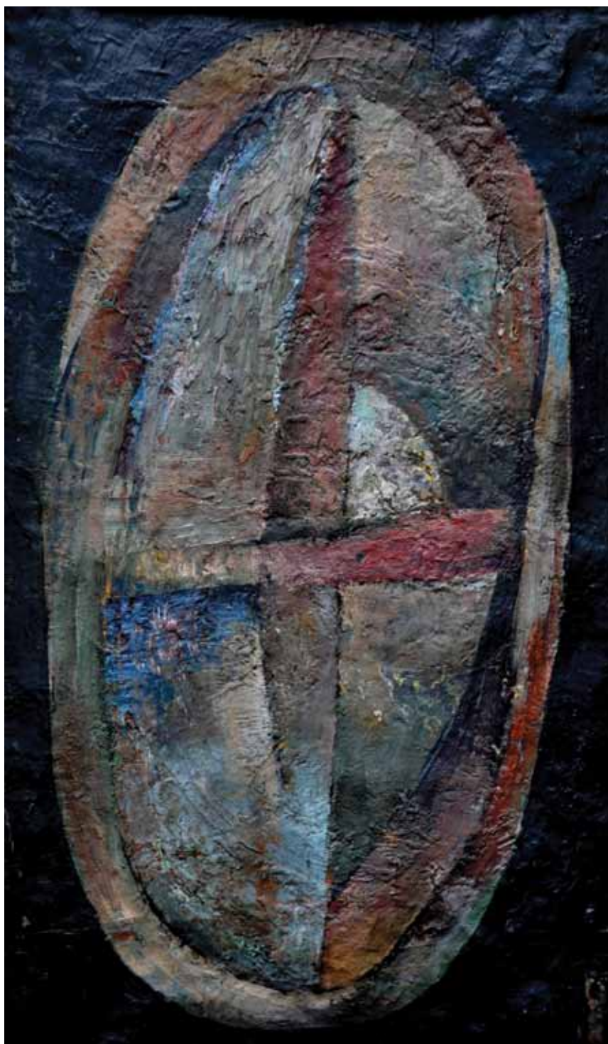
A kerék, 1966., o., v., 44 x 27 cm