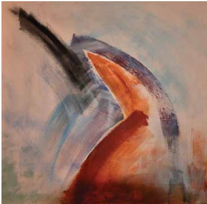
Föld-Levegő , 1979. akril, v., 100 x 100 cm