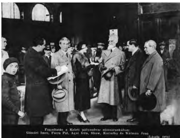
Színházi Élet, 1934. április 1-7.