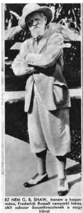
Pesti Napló Képes Műmelléklet , 1933. március 12.