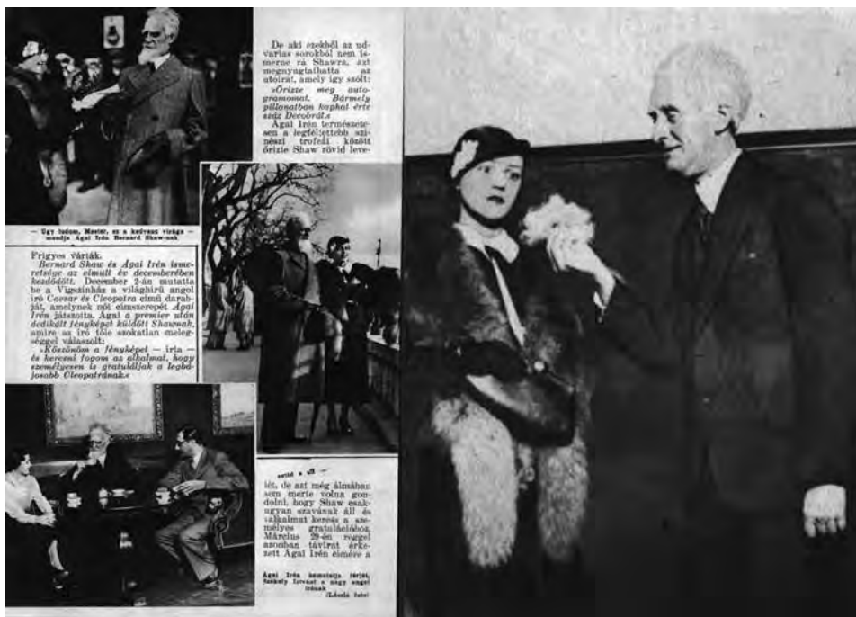
Színházi Élet, 1934. április 1-7.

Bernard Shaw budapesti látogatására tehát ezúttal sem került sor. És Shaw később sem látogatott el Budapestre. De ez az (ál)hír, beszámoló, interjú a cikket illusztráló fotókkal együtt sokkal érdekesebb és sokkal több figyelmet érdemel, mint ha Shaw ténylegesen is járt volna nálunk.