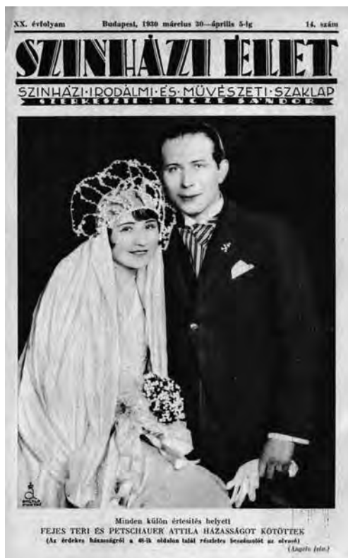
Színházi Élet . 1930. március 30–április 5.