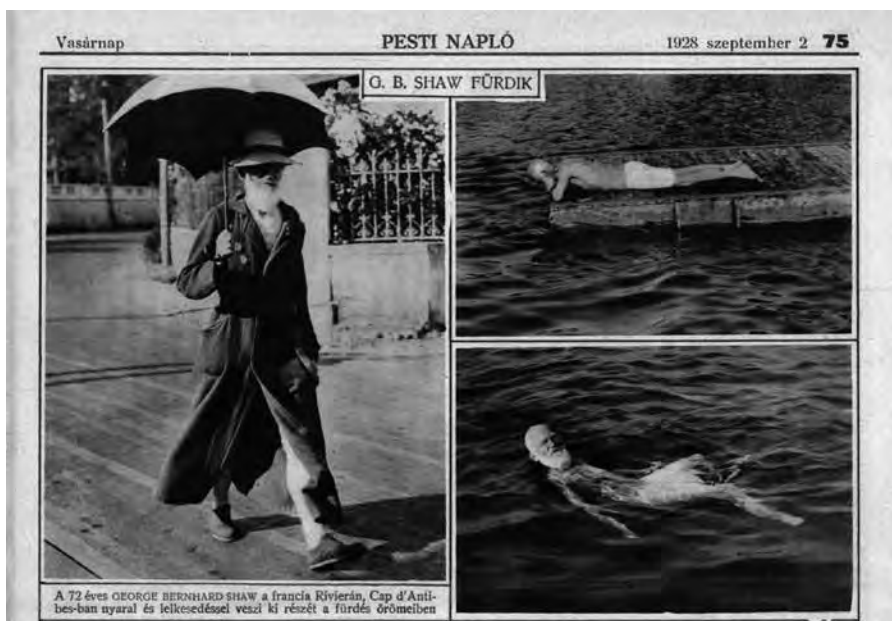
Pesti Napló Képes Műmelléklet, 1928. szeptember 2.

Azt, hogy ez a nyurga és virulens vegetáriánus, ez az angol szövetruhában és bricseszben feszítő télapó milyen dédelgetett figurájává vált a sajtónak, érdemes egy hazai példával demonstrálni. A Pesti Napló vasárnapi képes melléklete 12 oldalas, nagy példányszámban megjelenő fotórevü volt, a korszak politikai eseményeinek, kulturális és mindennapi életének könnyű kézzel és nagy profizmussal szerkesztett reprezentatív kavalkádja. Elsőrangú magyar fotóriporterek – Balogh Rudolf, Escher Károly, Munkácsi Márton – képei mellett a nagy világlapok és hírügynökségek képanyagával garázdálkodott. Nos, ez a lap 1928–1933 között, vagyis a Shaw magyarországi látogatását megelőző hat évben 31 számban összesen 35 fotót közölt az íróról – átlagban tehát minden tizedik héten!