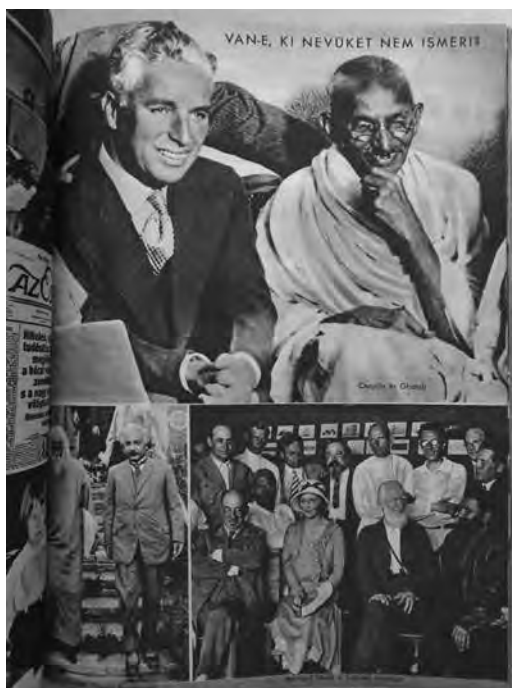
Az Est 25 éves jubileumi albuma, 1935.

Az efféle ismertetőjegyek jelentőségét jól érzékelteti Oliver Sacks neurológiai esettanulmányokat tartalmazó nagyszerű könyvének ( A férfi, aki kalapnak nézte a feleségét ) egyik mozzanata. A címadó esszé prosopagnósiában szenvedő hőséről olvassuk: „Nagyjából senkit sem ismert föl: sem a családját, sem a kollégáit, sem a tanítványait, sem önmagát. Egy portrén ugyan felismerte Einsteint, de csak azért, mert észrevette jellegzetes haját és bajuszát...” 7 Nagyon valószínű, hogy „a férfi, aki kalapnak nézte a feleségét”, Bernard Shaw-t is felismerte volna, ahogy Einsteint, hajviseletének, hosszúkás fejformájának, busa