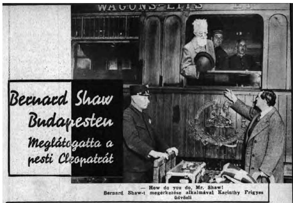
Színházi Élet, 1934. április 1-7.

Budapestre látogatott Bernard Shaw – erről számolt be a legolvasottabb korabeli képes hetilap, a Színházi Élet 1934 áprilisában. A cikk első oldalának fotóin Karinthy Frigyes üdvözlözi a Keleti pályaudvarra érkező író-t. Régi ígéret, régi óhaj vált ezzel valósággá. Hiszen a Pesti Napló már negyedszázaddal korábban, 1910-ben felröppentette a hírt: a néhány év alatt világszerte ismert drámaíróvá és hírhedt közéleti figurává váló Bernard Shaw, akinek darabjai egyre-másra bukkantak fel színházaink műsorán, Magyarországra készül. Két év múlva a Lipótvárosi Kaszinó hívta meg, hogy tartson náluk előadást, amire a sajtó értesülései szerint Shaw ígéretet is tett. De akárcsak a korábbiól, ebből a látogatásból sem lett semmi. Egy évre rá a Világ című napilap kürtölte világgá, hogy inkognitóban fog megérkezni a szomszédunkba, Bécsbe, a Pygmalion ősbemutatójára, de hamarosan kiderült, hogy ez az értesülés is valótlan volt. Shaw magyarországi híre és reputációja az első világháborút követően is nagyjából töretlen maradt. Ebben oroszlánrészét vállalta a neves rendező, Hevesi Sándor, a Nemzeti Színház igazgatója, az író darabjainak fordítója és fáradhatatlan propagátora, aki az 1920-as években írt és szerkesztett egy Shaw-breviáriumot is.