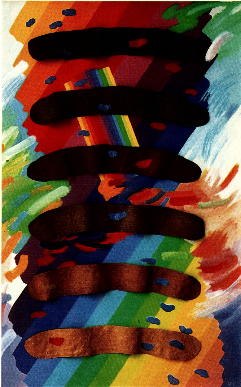
Sugárzás, 1985, olaj, vászon, applikáció, 120 × 80 × 3 cm