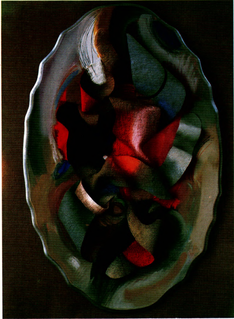
Hommage à Léger, 1987, olaj, fa, vászon, applikáció, 115 × 73 × 7 cm