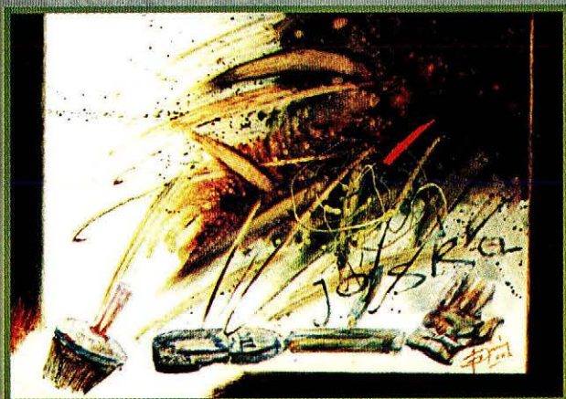
A Bucka-Gányó művésztelep emlékére