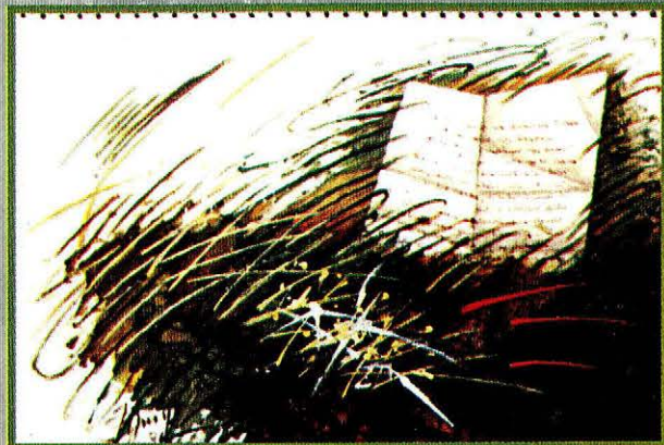
Levél a magyarsághoz