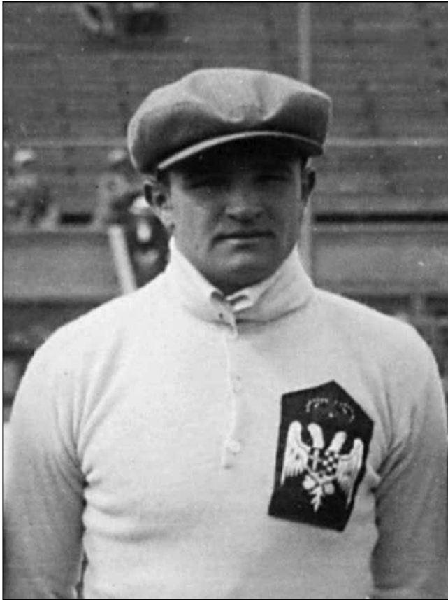
Siflis Géza (1907–1948)

Még a legtitokzatosabb életutak esetén is mindig marad egy nyom, amelyen el lehet indulni. Én ezt tettem, mert a múltunkat ismerni kell, a múltunkról mindig beszélni kell.