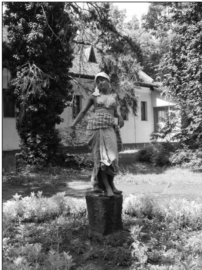
A régi épületszárny bejáratánál „mesél” a cigány lány...