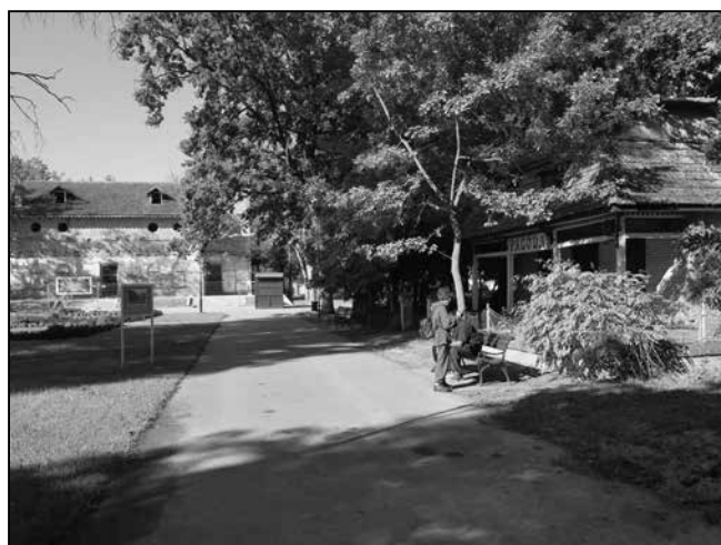
Felújításra vár a Vigadó és a Pagoda

emléktárgyat sem. Valamennyin szerbül, cirill és latin betűkkel volt olvasható: Banja Kanjiža . Ő végül is a Gyógyfürdő szimbólumává lett cigány lányos kávésbögrét választotta. (Elmondása szerint a rajta lévő ismertető cédulán olvasta, hogy a bögrét egy szerbiai gyárban állították elő, de a minta egy magyarkanizsai grafikai műhely szolgáltatása.) Jómagam sokáig nem tudtam: mitévő