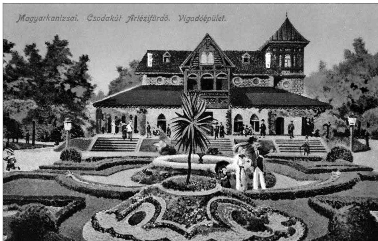
Egykori képeslapon a Vigadó és előtte a díszpark

A Gyógyfürdő új főépülete 1979-ben épült meg, és 1980. január 1-jén kezdte meg működését, 150 ágygal és korszerű rehabilitációs lehetőségekkel. Emellett az új létesítmény modern sportcsarnokkal, két fedett medencével, 300 fős étteremmel bővült. 1985-ben a Gyógyfürdő régi épületének felújításával, az Abella rehabilitációs szárny továbbépítésével a Gyógyfürdő 300 férőhelyes lett. Egy évszázados fennállása alatt, mint olvasom, a fürdő korszerű, szakosodott rehabilitációs kórházzá nőtte ki magát. Mára az orvosi rehabilitáció mellett szállodai és vendéglátói szolgáltatásokkal, sportolási és szabadidős lehetőségekkel, valamint wellnessprogramokkal várja vendégeit. A nyugalmat, természetközeli