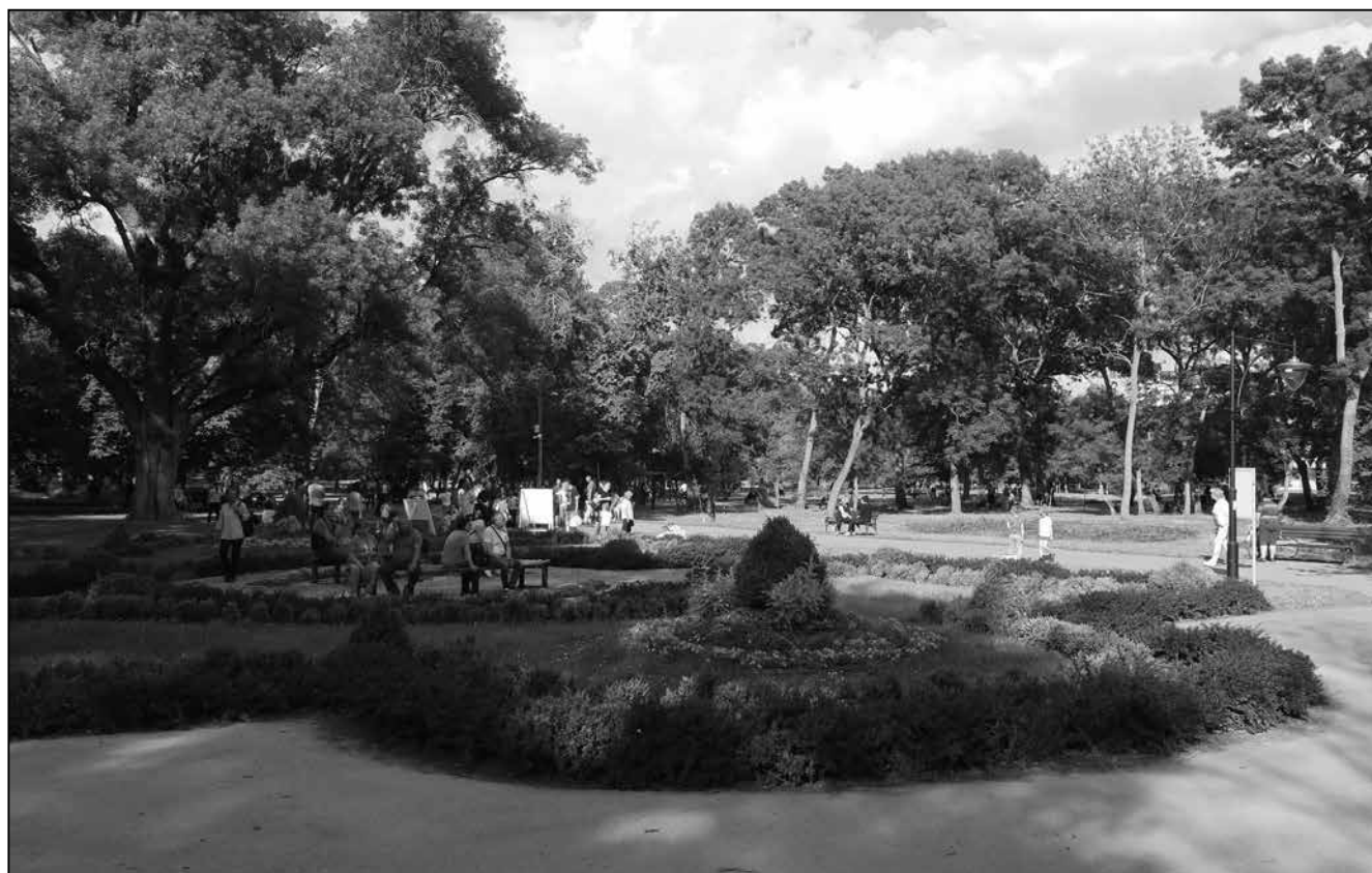
Az egykori park oázisa ma így néz ki, de még mindig kikapcsolódást nyújt

élményt, kikapcsolódást keresők számára a kellemes környezet a park ölelésében, 87 méteres tengerszint feletti magasságban felüdülést jelenthet. A természet ajándékának, a gyógyvíznek és a gyógyiszapnak nevezett peloidnak (amelyet a Járásról hoznak) köszönhetően pedig korszerű szakkórház is, amelyben egyaránt lehetséges a reumatikus betegségek, a csont- és ízületi sérülések, a perifériás idegrendszeri panaszok, a műtét utáni ortopédiai állapotok, a gyermekekénél pedig a központi idegrendszeri károsodások kezelése. A szállodai részben igénybe vehetők a különböző prevenciók, antistressz-, gyógy- és sportprogramok is. A három kútból nyert gyógyvíze (41, 64 és 72 °C) nátriumot, szénhidrogéneket, jódot, brómot és szulfidokat tartalmaz.