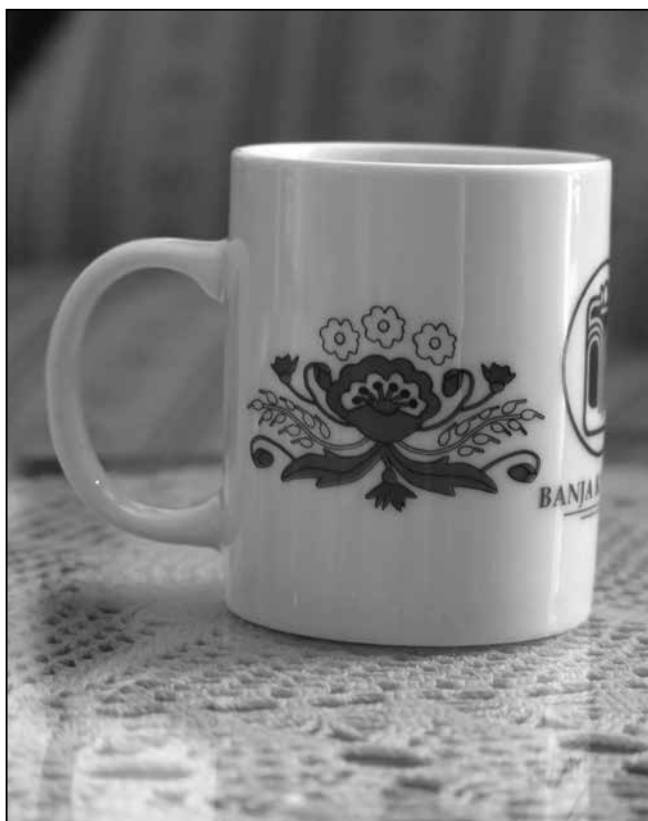
Vadvirágok az emléksészén...