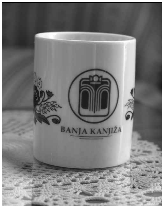
...Banja Kanjiža felirattal