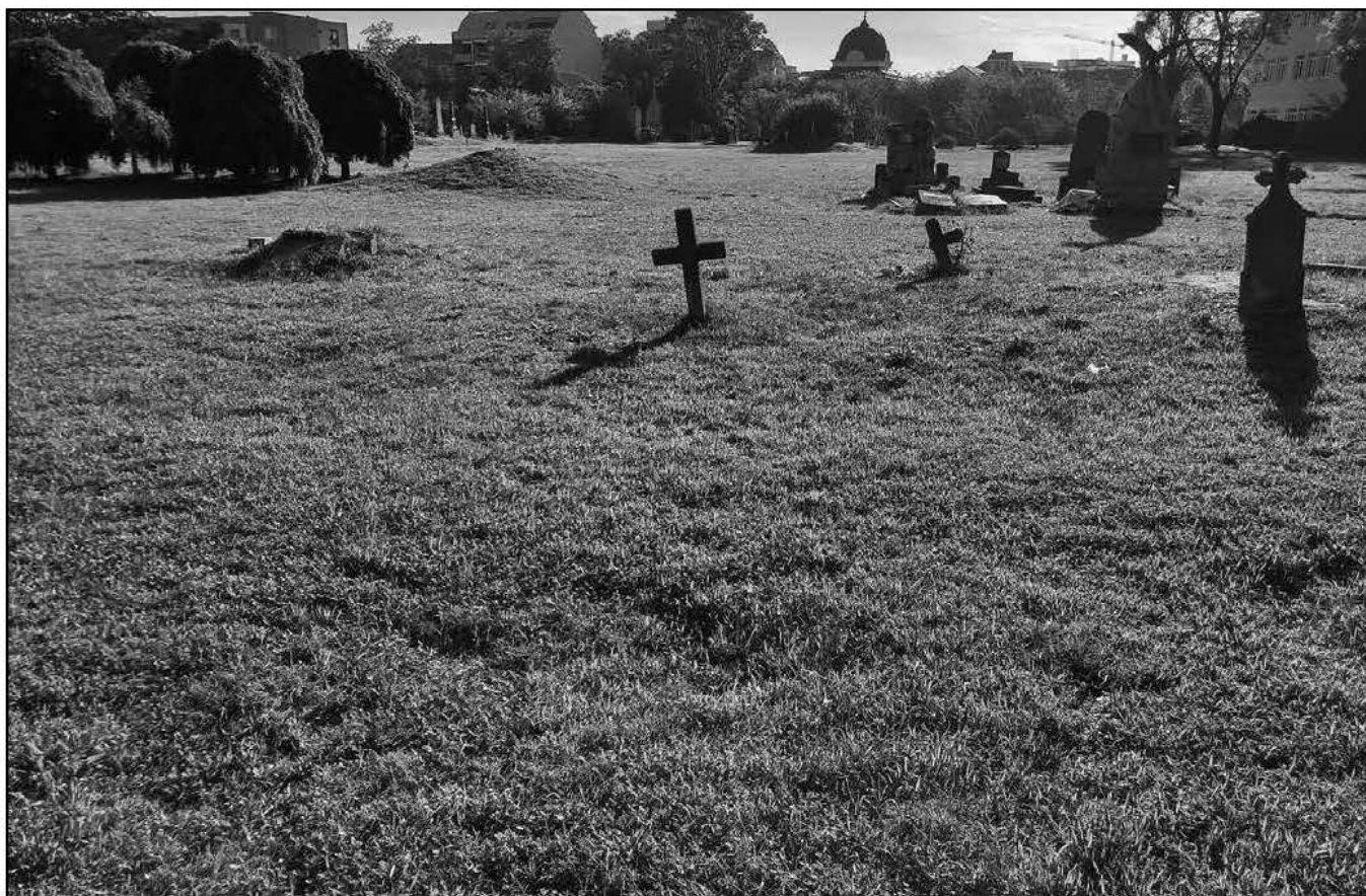
Fűtakaró borítja a jelöletlen hősi halottak sírjait