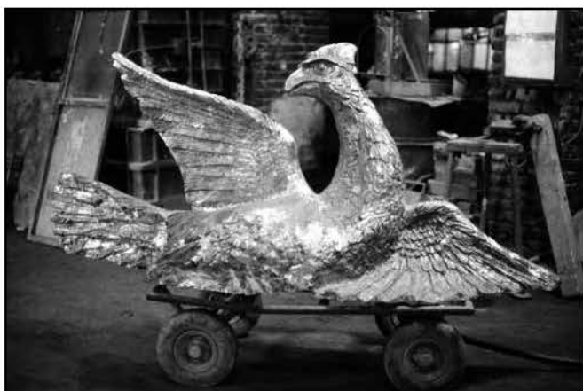
Elkészült az első szobor a '44-es népiirtás emlékére