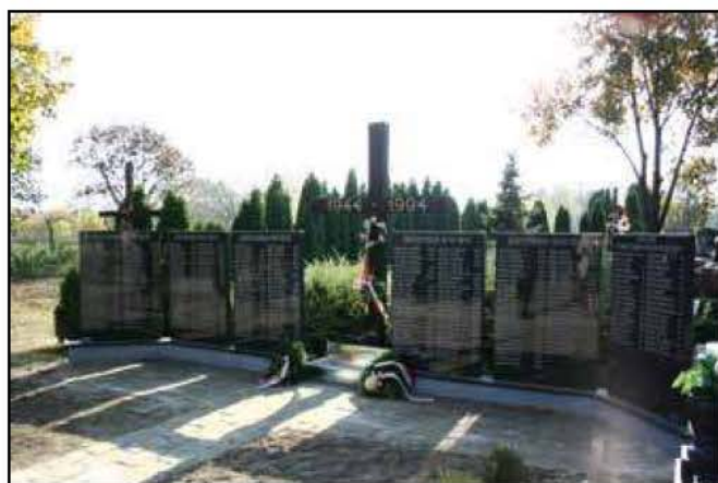
Temerin, a nagy tömegsír