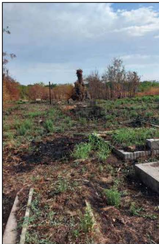
A gatzól megtisztított tömegsír, 2024