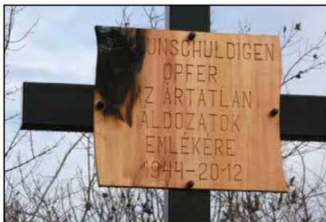
Megrongálva az emléktábla, 2013