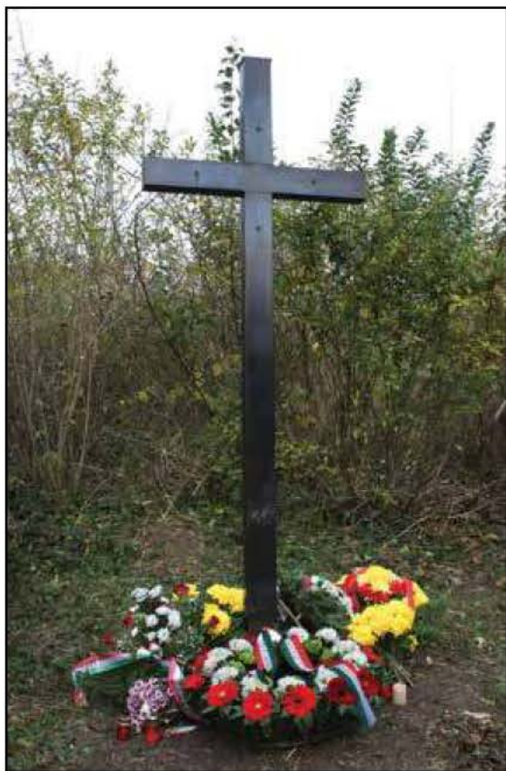
Tábla nélkül a kereszt, 2014