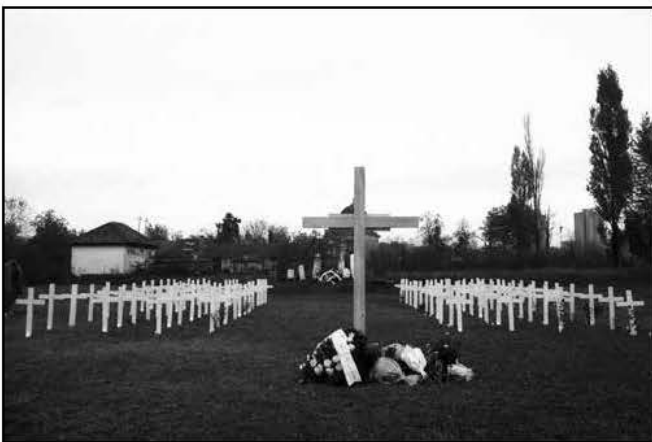
A nagy kereszt száz kicsire vigyáz a Futaki úti temetőben