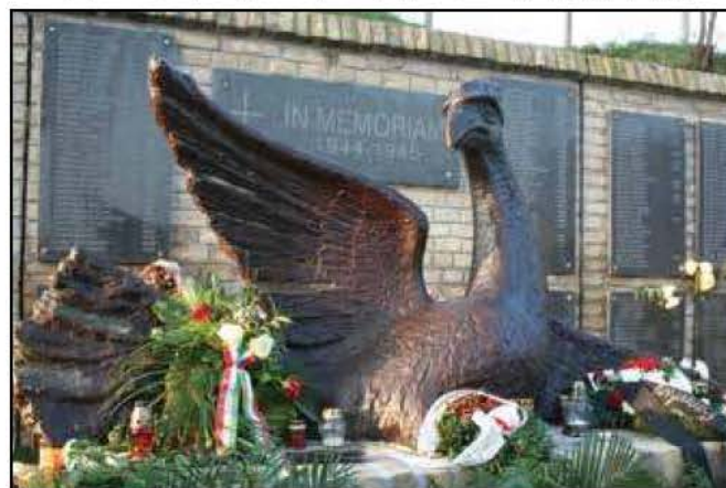
Egy belgrádi céggel öntették ki a szobor másolatát, amelyet 2014-ben avattak fel