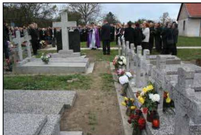
Bezdán – Isterbác, a nagy kereszt és a kis kereszték sora