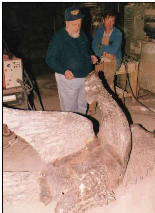
Az Antal öntöde fotója