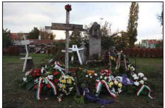
A kitépett keresztből csak néhányat sikerült megmenteni a szeméttelapról