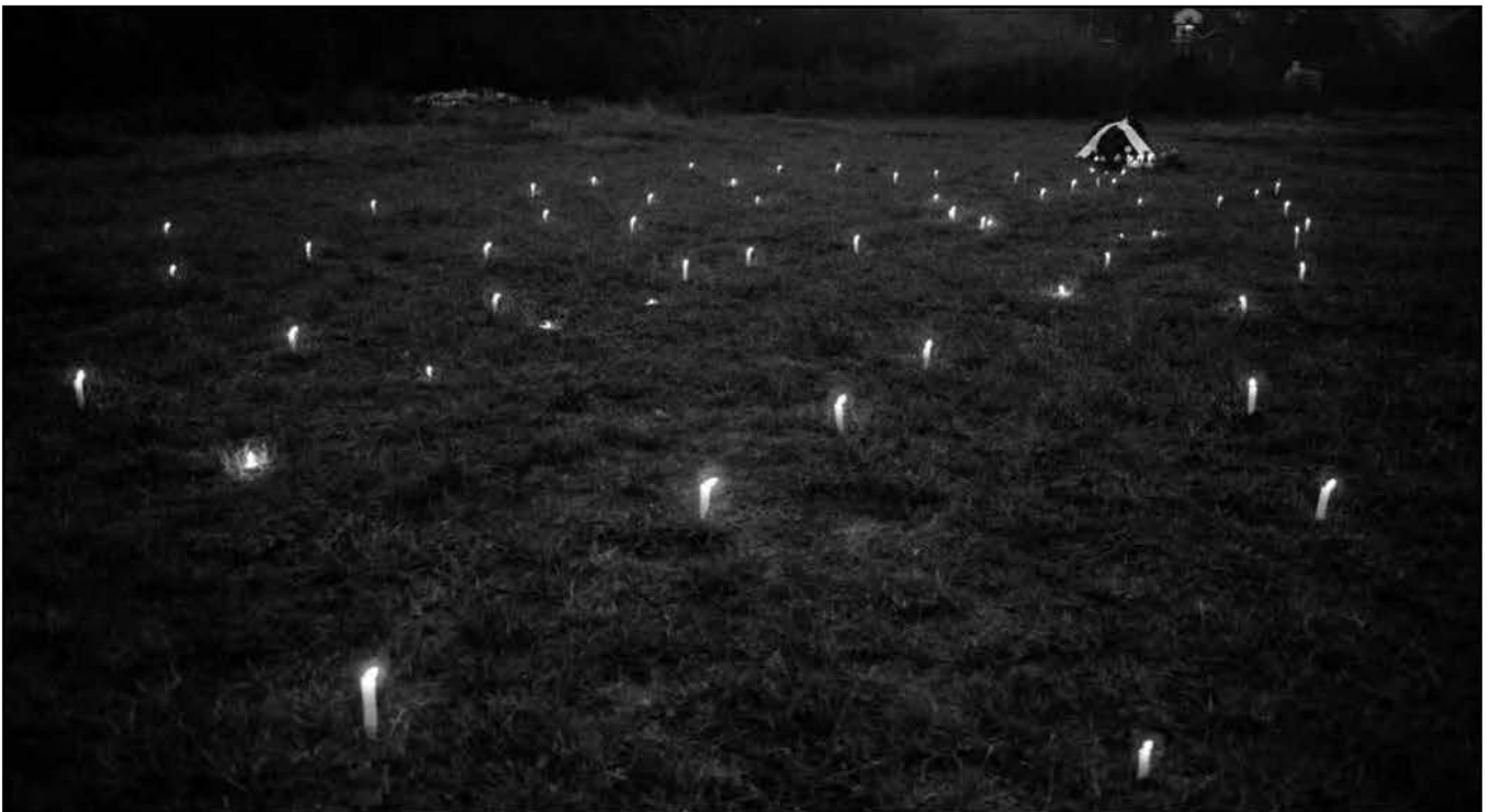
Gyertyák égnek a kitépett kereszték helyén