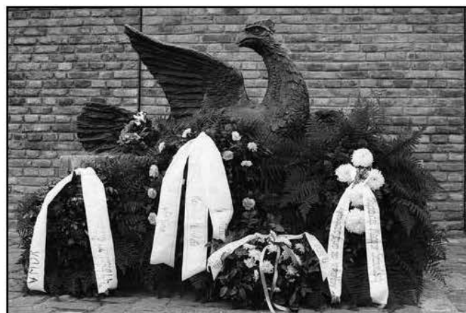
1994. november 2-án volt az ünnepélyes avató