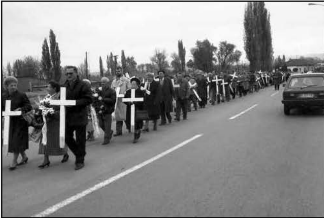
Indulnak az emlékezők a száz hófehér kereszttel