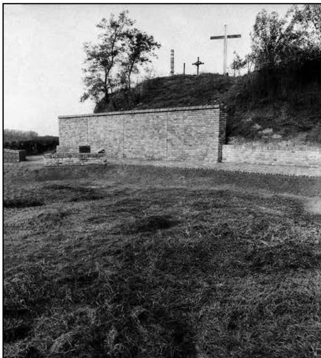
A régi téglagyár gödrében a tömegsír helyszínén épül az emlékhely