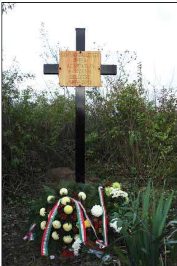
Embermagasságú gazzal övezett emlékkereszt, 2012