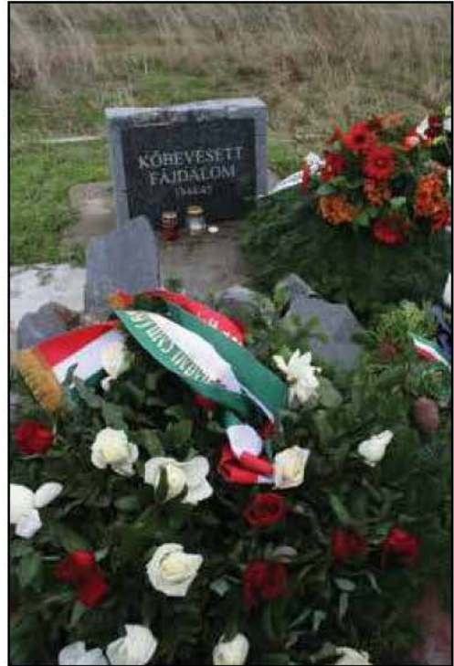
A dögtemető és szeméttelp helyére hantolták el az áldozatokat, holtukban is meggyalázza őket