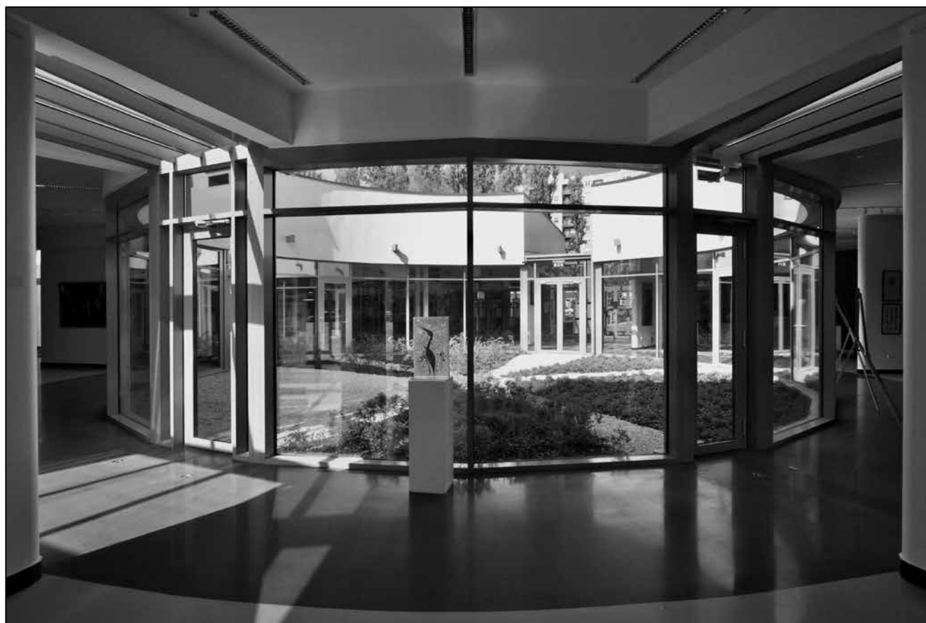
Vadász György: Radnóti Miklós Művelődési Központ (RaM), Budapest

Megjegyzés: a = anyanyelv, n = nemzetiség. Forrás: VARGA E. (III. kötet) 2000, 559–560. pp.; Population statistics of Eastern Europe & Former USSR: http://pop-stat.mashke.org/#romania (Letöltés ideje: 2025. február 4.)