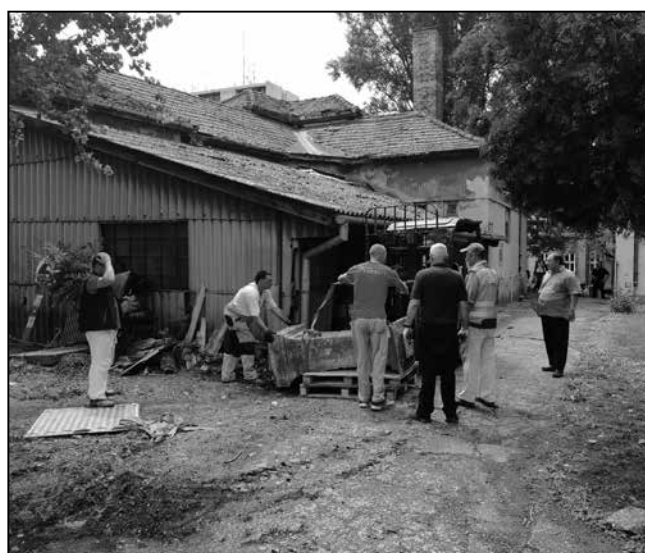
A talapzatot a vasútállomás felújításakor eltávolították

– Valójában az Erzsébet-szobor utáni kutatással kezdtem jobban érdeklődni a szobrok, az emlékművek iránt. Magam is tapasztaltam, hogy hiányoznak történelmünk egyes darabjai. Vannak, de nem láthatóak, így kiesnek tudatunkból. Nincsenek itt, eltávolították azokat a szobrainkat, amelyek a magyar identitást erősítették. De eltávolítottak olyan szobrokat is, amelyek egy cseppet sem a magyar identitásról szólnak, pl. Erzsébet királyné szobra nem csak a magyar történelemhez kötődik. Ez a régi monarchiabeli szobor most nagyon jól mutatna a városban, ha meglenne.