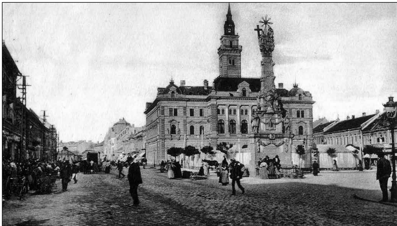
Újvidék, a Ferenc József tér egykor

A felállított országzászló az egykori Ferenc József téren (ma Szabadság tér) állt a város központjában, a Mayer Nagyszállóval szemben. Az emlékmű a nemzeti összetartozás és a történelmi igazságtétel jelképévé vált. Az országzászlót a jugoszláv partizánegységek bácskai bevonulása, 1944 után eltávolították, és visszaállították a Svetozar Miletić-szobrot. Az eredeti talap-