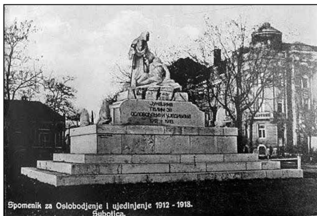
A felszabadulásért és egyesülésért elesett hősök emlékműve

Az autóbusz-állomásról a városközpont felé haladva Szabadkán nem lehet nem észrevenni egy emlékművet, a katonát tartó Jézust. Az Ivan Sarić Műszaki Iskolával szembeni Puskin téren látható „A felszabadulásért és egyesülésért elesett hősök – 1912–1918” feliratú emlékmű. Korábban egy kicsit távolabb, a bíróság előtti téren állt. Nem tudni, hányan ismerhetik a történetét.