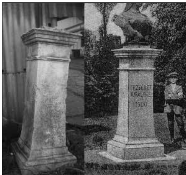
Erzsébet királyné mellszobrának talapzata (balról) és az eredeti emlékmű egykori képeslapon

szobrokat avattak fel, így például Muzslán 1899. január 8-án és a következő két évben kettőt is Szabadkán. Sisit (ahogyan a nép nevezte) bajor származása sem akadályozta meg abban, hogy megtanuljon magyarul. Bizonyára ez is hozzájárult ahhoz, hogy kultuszszeméllyé vált. Mi, magyarok mindig nagy figyelmet szenteltünk a történelmünk nőalakjainak. Szabadkán két híres szobrász művét állították fel. Az egyik Stróbl Alajosé, akinek a gyönyörű Szent István-szobra a budapesti Halászbástya mellett látható, valamint ő alkotta a Mátyás-kutat a budai várban és Dobó István szobrát Egerben. A Budapesten 1900 szeptemberében kiadott Vasárnapi Ujság Erzsébet királyné emléke Szabadkán című cikkében olvashatjuk: „A feledhetetlen emlékü jó királyné iránt országosan érzett mély, megható kegyelet kifolyásaként, ezer meg ezer helyen ültettek emlékfákat a hazában; többek közt a szabadkai vasúti állomáson, hol egyszersmind a Szutrély Gyula főmérnök tervezete szerint, csinos parkot is létesítettek. Majd Kovács János főmérnök indítványára elhatározta a vasúti személyzet, hogy emez emlékparkot a boldogult királyné szobrával ékesíti föl. A szükséges összeg csakhamar összegyűlvén, felállíthatták Strobl Alajos mintázat után Beschorner által öntött életnagyságú bronz mellszobrot, amely most díszes talapzaton, a szomorú fűzfák árnyában, ott hirdeti távoli vidékek utasainak a szabadkai derék vasutasok kegyele-