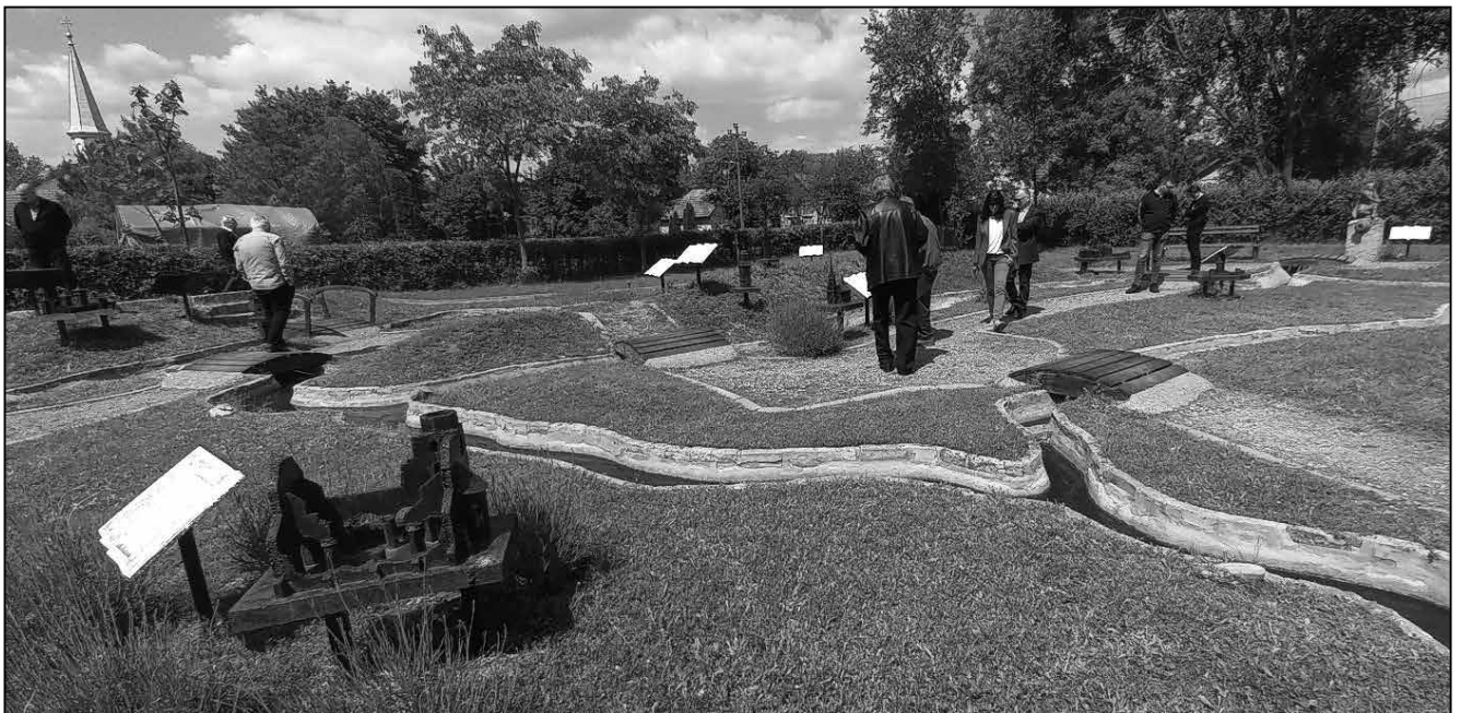
Emlékséta Tóthfaluban május 10-én Szabó Hunor vezetésével