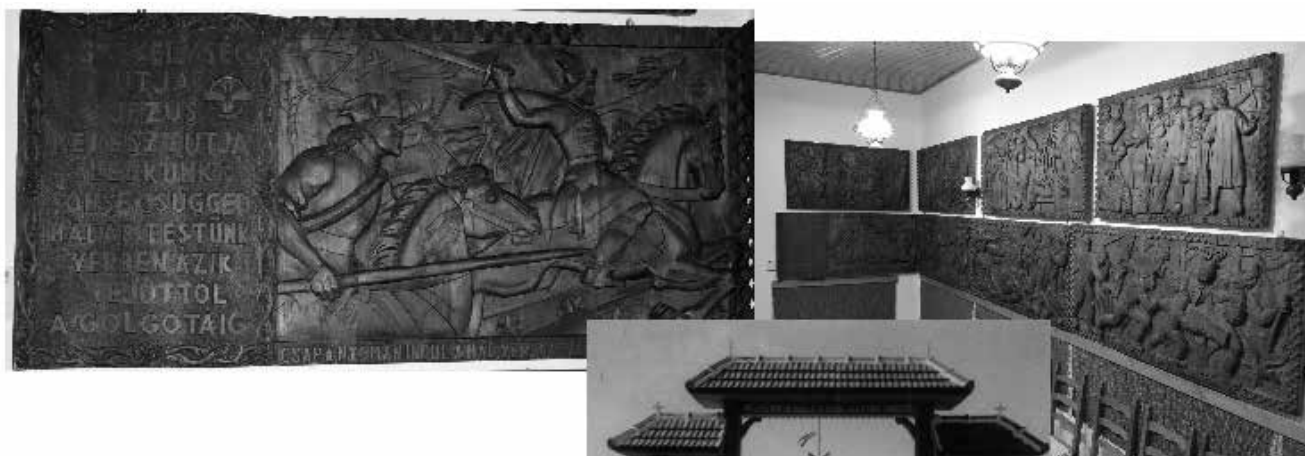
A bukovinai székelyek emlékei: Zenélő kút, Szent István-szobor és a Székely kálvária – Újnagyfény, Bácsjózseffelva, Bajmok melletti székely telep