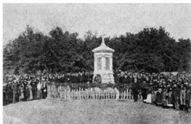
Rudolf trónörökös emlékműve – Kölpény (Szerémség)