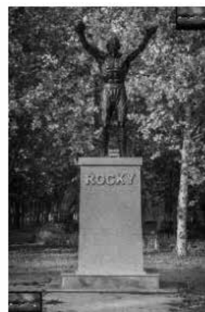
Kulturális forradalom vagy a múlt eltörlése – A kilenc női szobor, Begaszentgyörgy vs. Rocky-szobor, Žitište

Elszomorító számunkra a bukovinai székelyek sorsa. Erre emlékeztet bennünket Nagyfényen, pontosabban Újnagyfényen a Székely kálvária, amelyet az idetelepített székelyek faragtak. A székelyek 1941-ben érkeztek meg Bukovinából. 1944-ben viszont már menekülniük kellett... „Örökségül” hagyták a vasútállomás művészien, székely motívumokkal felújított épületét Újnagyfényen, vagy ahogyan ők nevezték, Bácsjózseffalván.