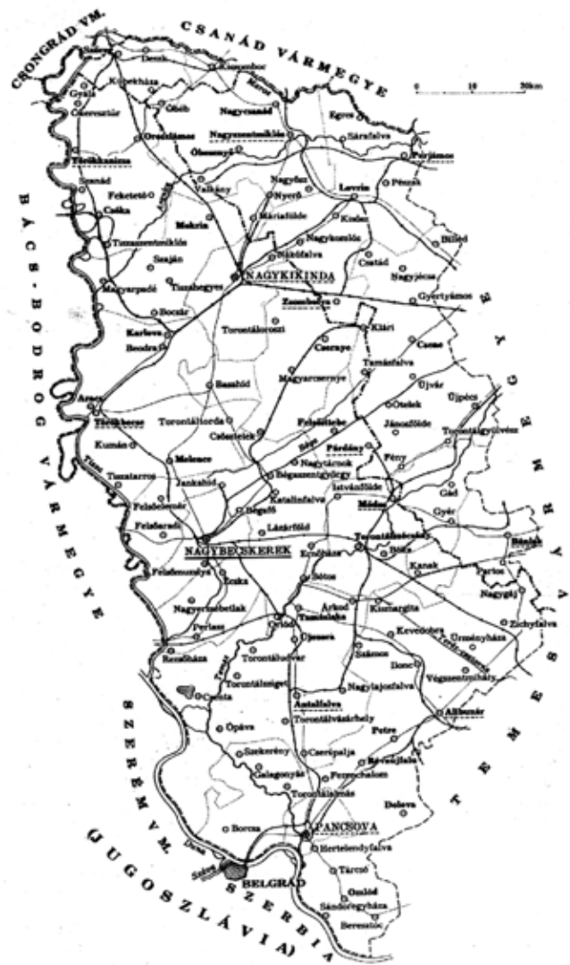
A történelmi Torontál vármegye egykori területe (1910) a délszláv–román határkorrekció után (1924) 6

A határkorrekció azért is vált fontossá, mert mindkét állam, azaz Románia és a Szerb–Horvát–Szlovén Királyság is igényt tartott a Bánság egész területére. Az antant és Magyarország között 1918. november 13-án aláírt belgrádi egyezmény lehetővé tette a délszlávok számára, hogy megszállják az egész Bánságot. Románia kezdetben azonban csak Erdély déli és keleti részéig jutott. A délszláv hadsereg lépéselőnybe került, és megkezdte a Bánság megszállását, illetve a délszláv államba való beolvasztását. Érdekességként jegyezzük meg, hogy a Bánság területén számos román papot letartóztattak, mert a liturgiákban I. Ferdinánd román királyt (1914–1927) és nem I. Péter szerb – 1918-tól szerb–horvát–szlovén – királyt (1903–1921) említették meg. A román vezetőség, látva a kialakult helyzetet, ragaszkodott ahhoz, hogy a francia csapatok elfoglalják a Bánság hegyvidéki (keleti) részét 1919. január végén. A szerbek továbbra is megszállták a Bánság nagyobb részét, de idővel egyre inkább nyugati irányba szorultak. Közben ideig-óráig megmaradt a régi magyar polgári közigazgatás. Románia és Jugoszlávia között a Bánság miatt diplomáciai konfliktus tört ki, amely fegyveres összeütközéssel fenyegetett. Az antant államoknak rendezniük kellett a kérdést. Mivel nyelvi-etnikai, illetve minden fél számára elfogadható határt szinte lehetetlen volt húzni, szükségesnek mutatkozott a határkorrekció a románok és a délszlávok között. 5