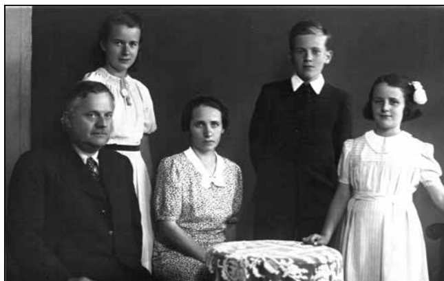
Bajai családi fotó, 1940 körül