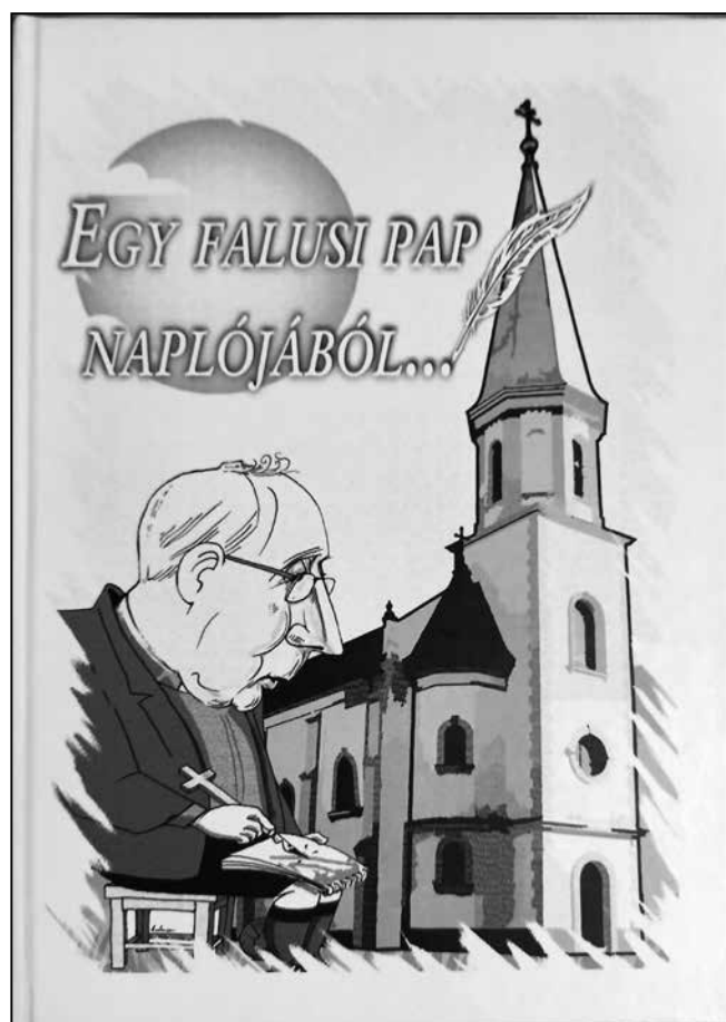
A 2024-ben megjelent napló címlapja

segített is a terveink megvalósításában a későbbiek során. Ideérkezésemkor a tetőszerkezetet kezdték felrakni éppen, ezt munkaakciókkal, szakmai segítséggel együtt fejeztük be. Utána következett a templom felújítása. Még a Franciaországból szabadságra hazajött falubeliek is kivették részüket a munkából, velünk együtt. Ott voltam én is, azt tettem, amit éppen kellett, hiszen nem volt számomra idegen a kétkezi munka. Ez a lelki megerősítésen túl fokozta a bizalmat köztem és a helybeliek között.