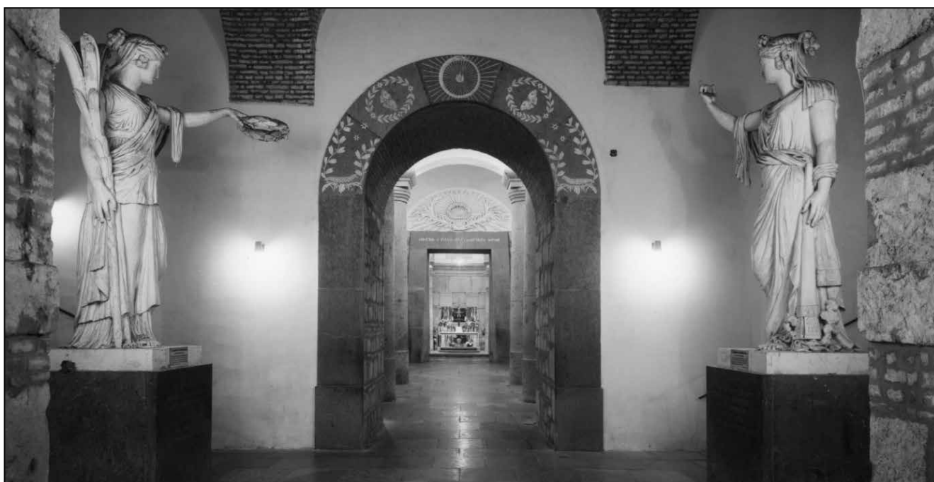
A bazilika attemplomának bejárata