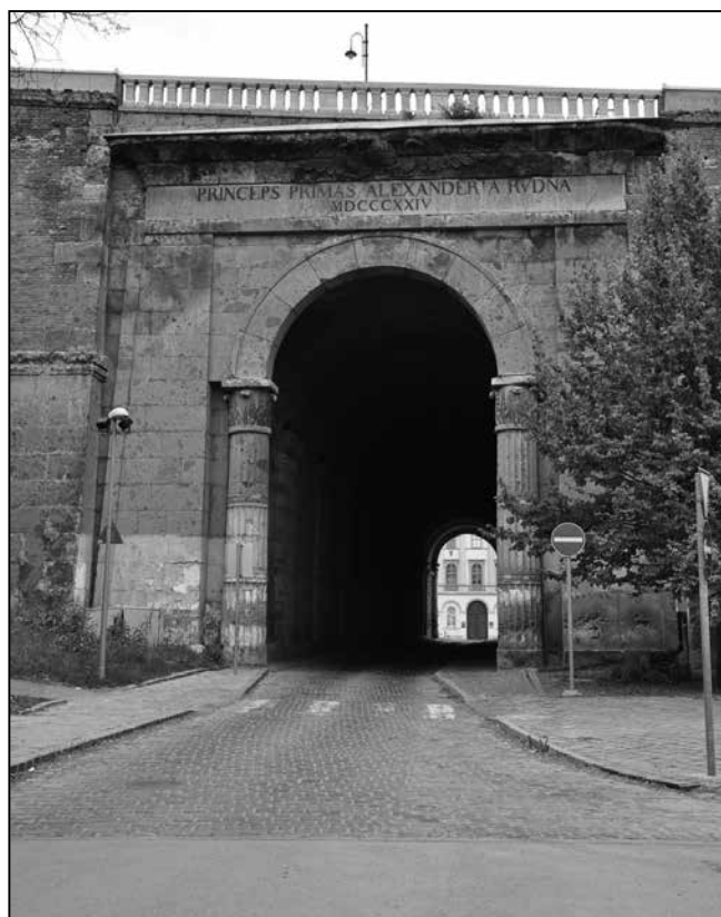
A Rudnay Sándor kinevezésének 5. évfordulóján emelt diadalkapu, a Magyar Sion bejárata a város felől

szükség, mert a kápolna körül az új székesegyház alapjait 13 méterrel mélyebbre helyezték, a Várhegy sziklájára, és ezzel egy szintre kívánták hozni a kápolnát, hogy teljesen eggyé forrjon a dicső magyar reneszánsz emléke a 19. századi klasszicista jelenkorral.