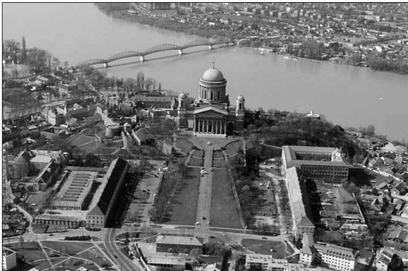
A Magyar Sion látképe az újjáépített Mária Valéria híddal a Duna felett

A 2000-ben újjáépített Mária Valéria híd ismét összeköti a folyam két oldalán élő lakosságot, mert a 21. században a politikai határok átjárhatók. A magyar nemzet ezeréves története és azon belül a Magyar Sioné arra tanít, hogy a magyar ember nem ismer lehetetlent, minden körülmény közepette is tud remélni és diadalmaskodni!