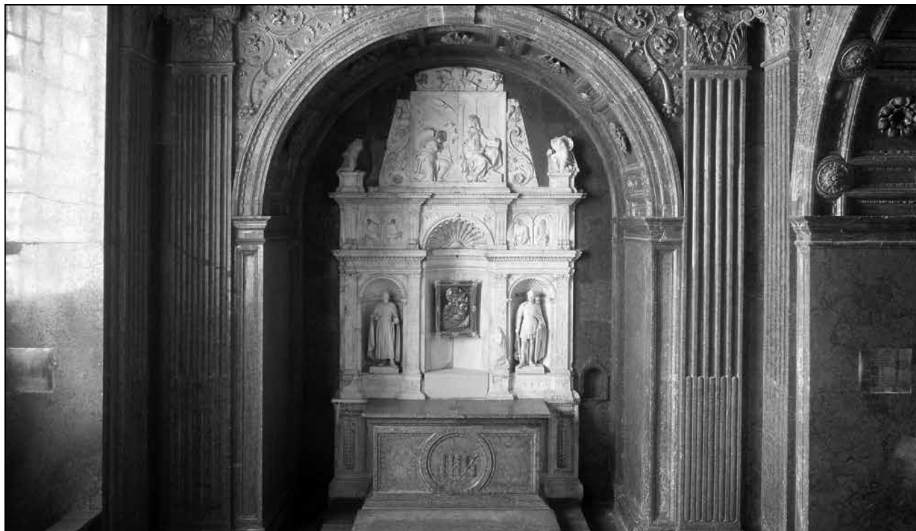
Bakócz Tamás primás sírkápolnája, 1506

1863-ban megindult a Magyar Sion című folyóirat Esztergomban.