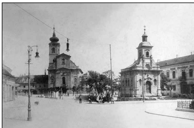
Az egykori Szent Dömötör-templom, előterében a Rozália-kápolnával – a Vajda Tamás A szegedi Dóm tér kialakítása és koncepciójának jelentősége c. cikk melléklete

A reménytelenség keserűségében a királyi látogatás ígérete, a „ Szeged szebb lesz, mint volt ” legendás mondása, a világ nagyvárosaiból érkező adományok, a késedelem nélkül kineve-