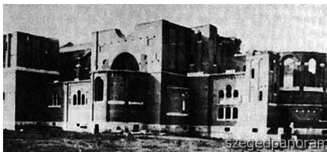
A félig kész Fogadalmi templom – A szegedi dóm a fogadalomtól az avatásig c. cikk melléklete