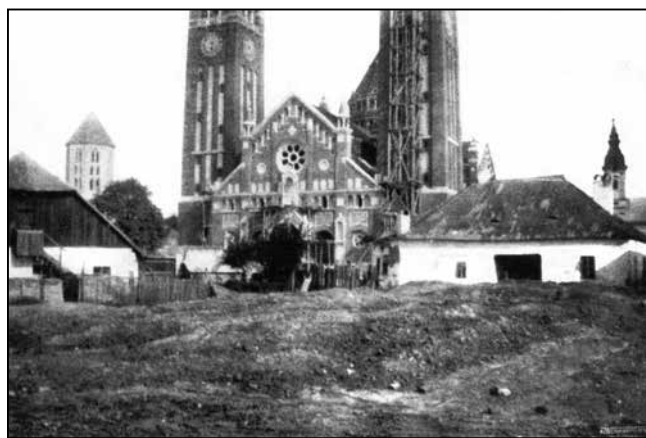
A mai egyetemi épületek egy részének helye – forrás: Rerrich Béla A szegedi Templomtér (1932–2002) c. könyvének hasonló kiadása, 2002, 17. old.

Az épületre 1,2 millió koronát, a belsőre 300 ezer koronát irányoznak elő. Leszerződnek 1909. május 23-án. Feszített elvárások a tervezési időre.