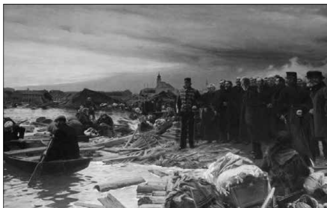
Vágó Pál festménye a szegedi nagy árvízről (Móra Ferenc Múzeum) – Az 1879-es szegedi árvíz c. cikk melléklete