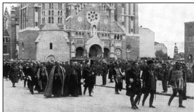
A templom és terének avatási ünnepe (felvételek a templomtéri ünnepekről)

A vázlattervek, a rövidebbre szabott határidő miatt, október helyett csak 1909 decemberére készülnek el. Módosításokat kérnek, mellékoltárok építését, illetve az építész javasolja egy kiemelésre, podesztra helyezését az egész templomnak. Pluszköltséggel – 200 ezer korona – elfogadják a fölvetést.