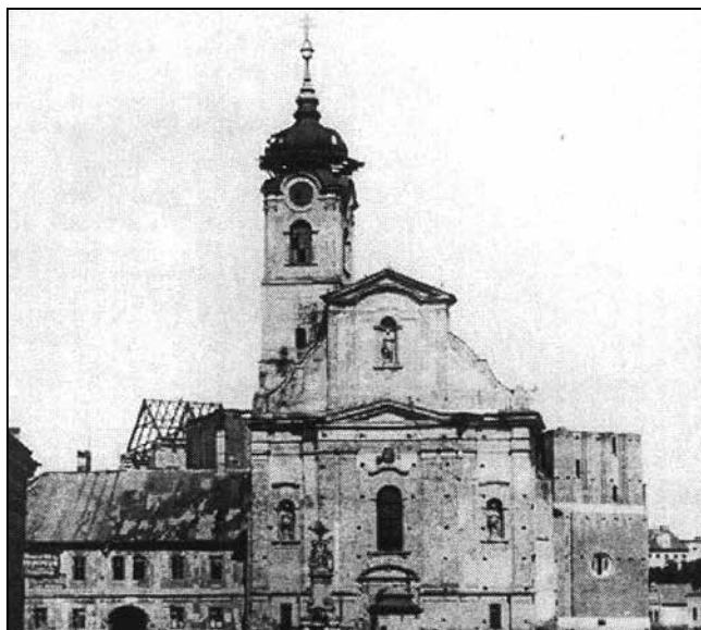
A Szent Demeter-templom 1913-ban, háttérben az épülő dómmal

Bár látszólagos megegyezés alakul ki 1883 januárjára a Szent Demeter-templom helyére – részben a mai templom helyén álló nagy múltú, felújítandó, akkor éppen barokk ruhát viselő templom –, annak elbontásával (Tisza Lajos is ezt javasolja a megszentelt hely okán), de a kérdés nem kerül nyugvópontra.