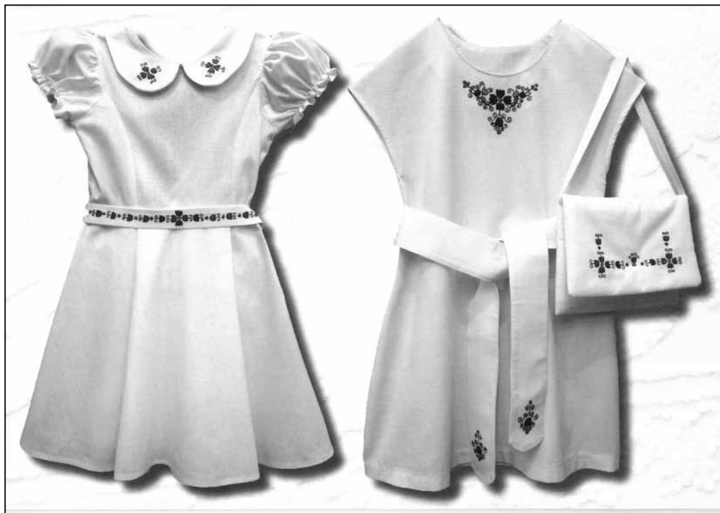
Sárközi díszítménnyel hímzett kislányruhák