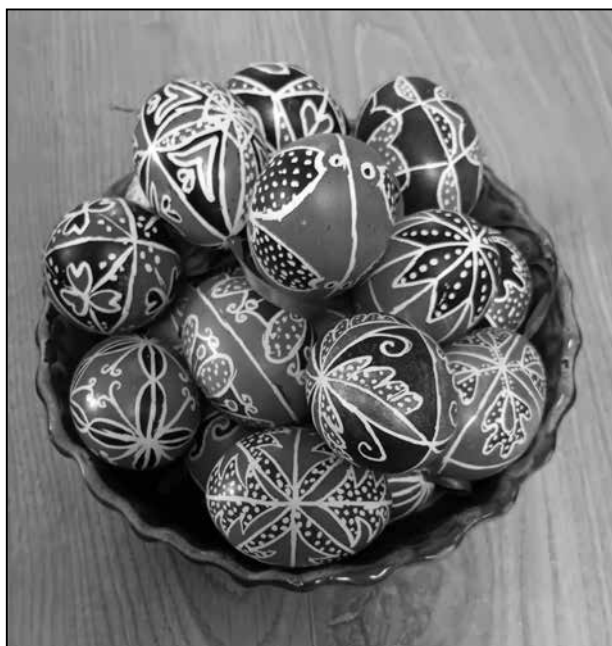
Írókával díszített, festett hímes tojások a Kárpát-medencéből