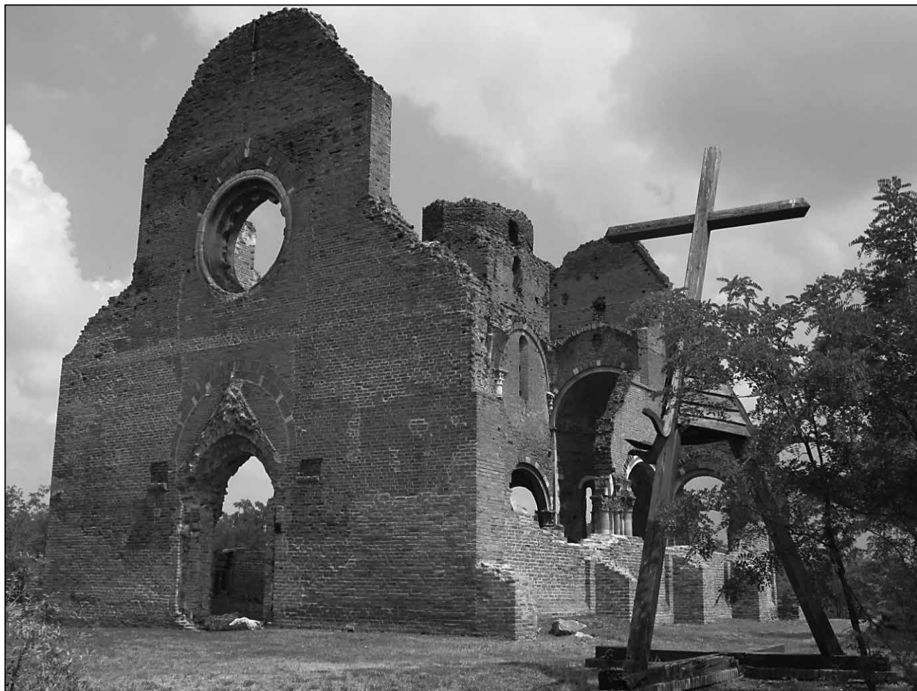
A délvidéki magyarság szimbóluma, az aracs pusztatemplom

becséhez), 1440-ben mint a becsei vár tartozéka jelent meg egy okiratban. Ekkor és 1441-ben egy másik okiratban mint „ oppidum ” (mezőváros) említették. Egyébiránt a középkori Torontál