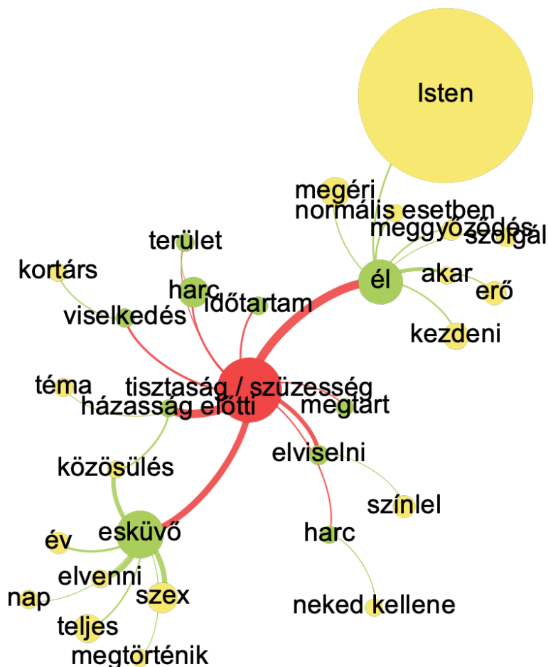
3. ábra. A czystość 'tisztaság, szüzesség' kulcsszó vizualizált kollokációs hálózata a katolikus korpusz alapján.

Ahogy korábban is említettük, statisztikai szempontból kiemelkedő csoportot alkotnak a tanúságtételek között a házasság előtti tisztaságról szólók, vagy azok, ahol az isteni beavatkozás segít az életre szóló társ megtalálásában és megtartásában (301 és mások). Figyeljük meg, hogy például a cięża 'terhesség' szó nagyon ritkán fordul elő a protestáns tanúságtételekben ( log-likelihood értéke 10 vagy kevesebb), míg a katolikus korpuszban számos kollokációt alkot, a być w ciąży 'terhesnek lenni' pedig a korpusz egyik kulcskifejezése.