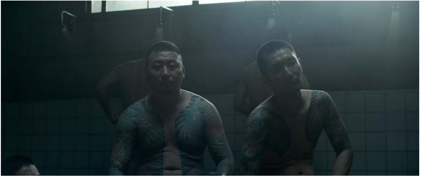
Yakuzák a börtönben