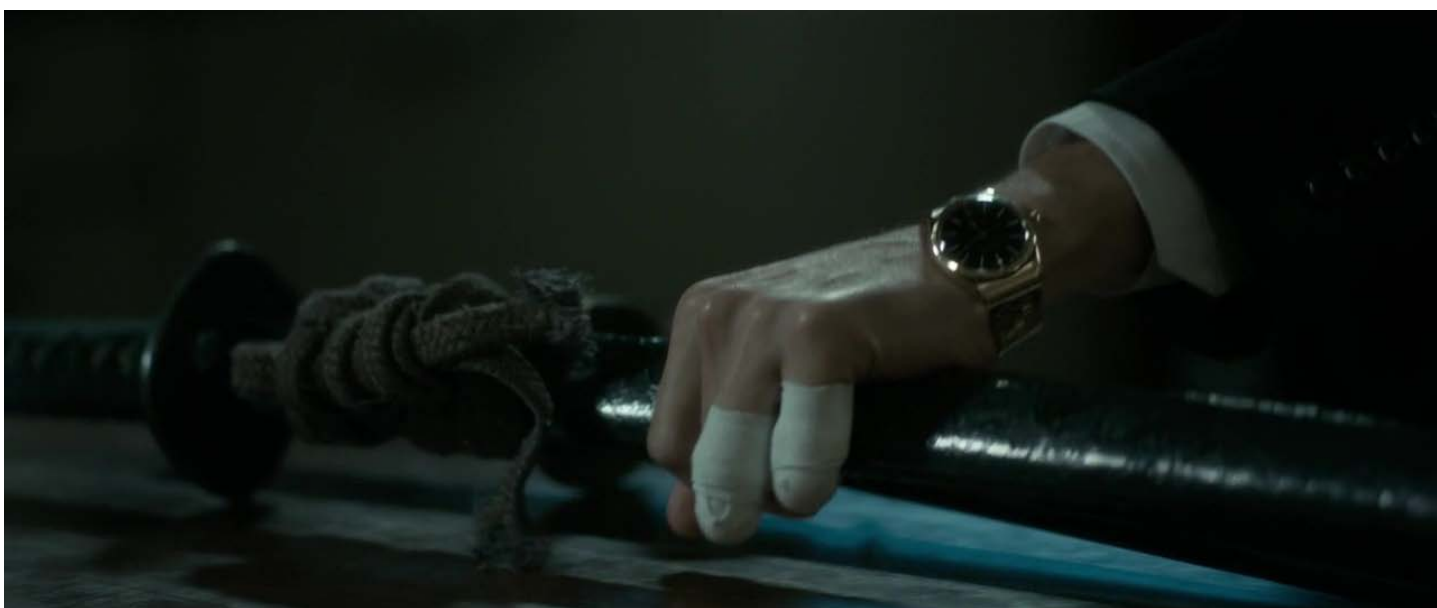
A hatalom kardjai...