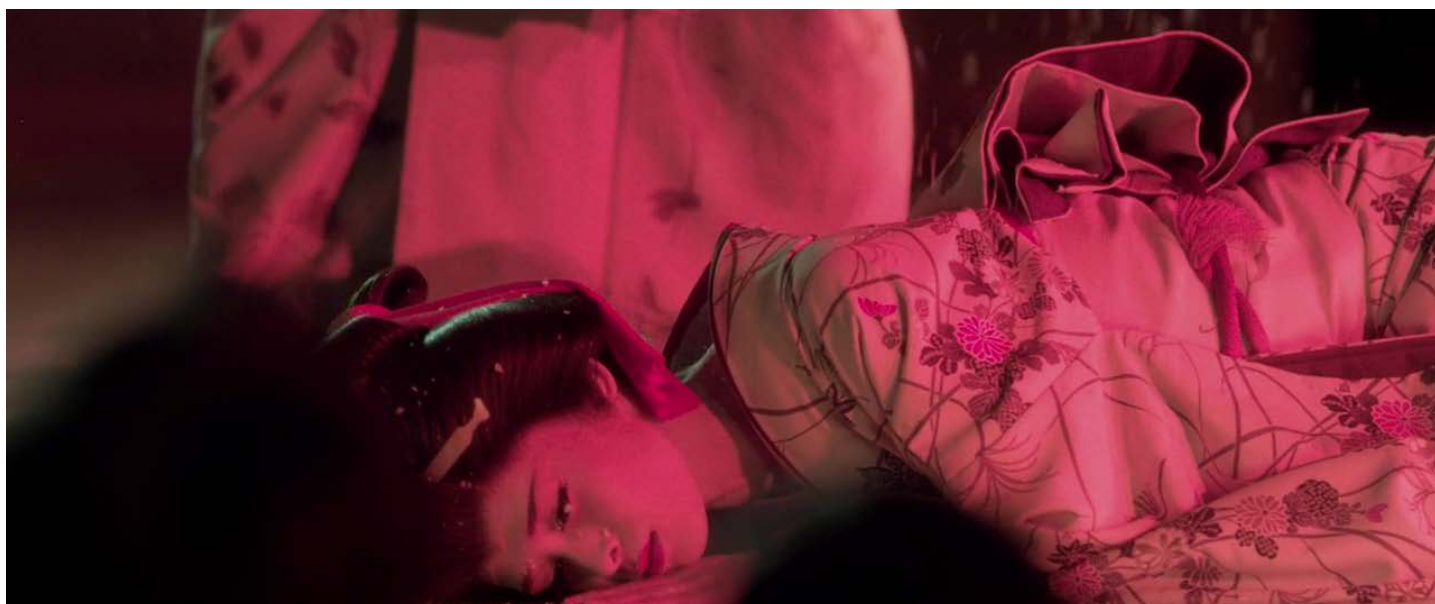
Színpadi szerelmi halál