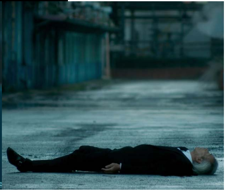
Kiyoshi, majd Akihiro halála