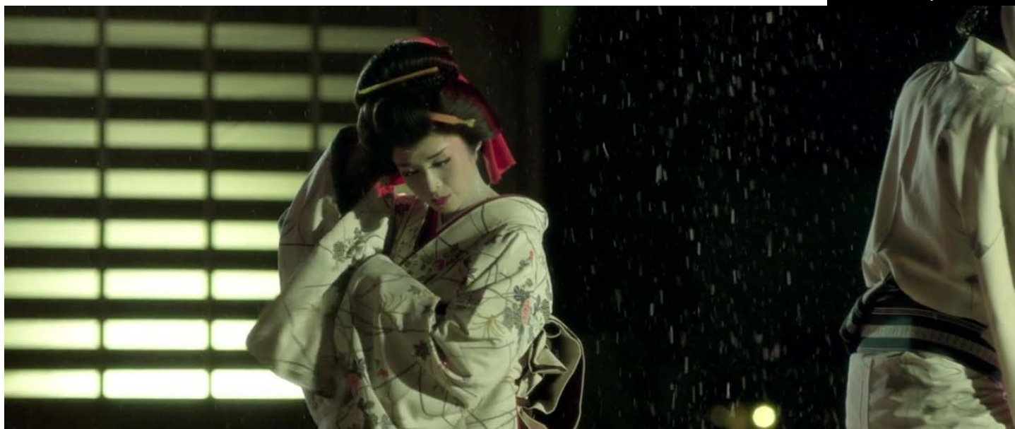
Tradicionális színpadi előadás