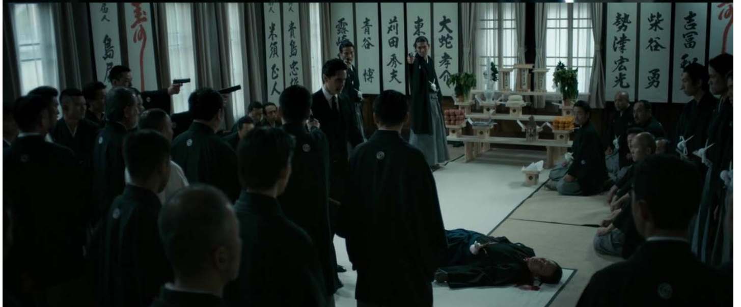
A kardrántás előtt és után...