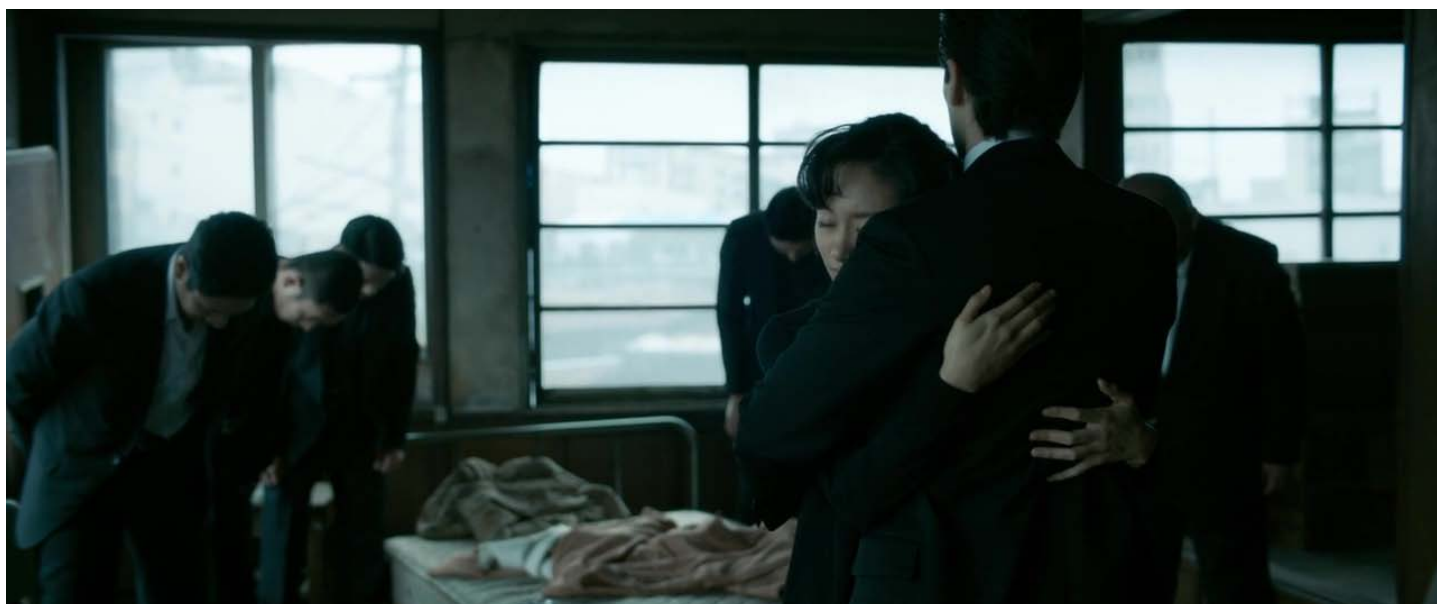
Együtt a család...