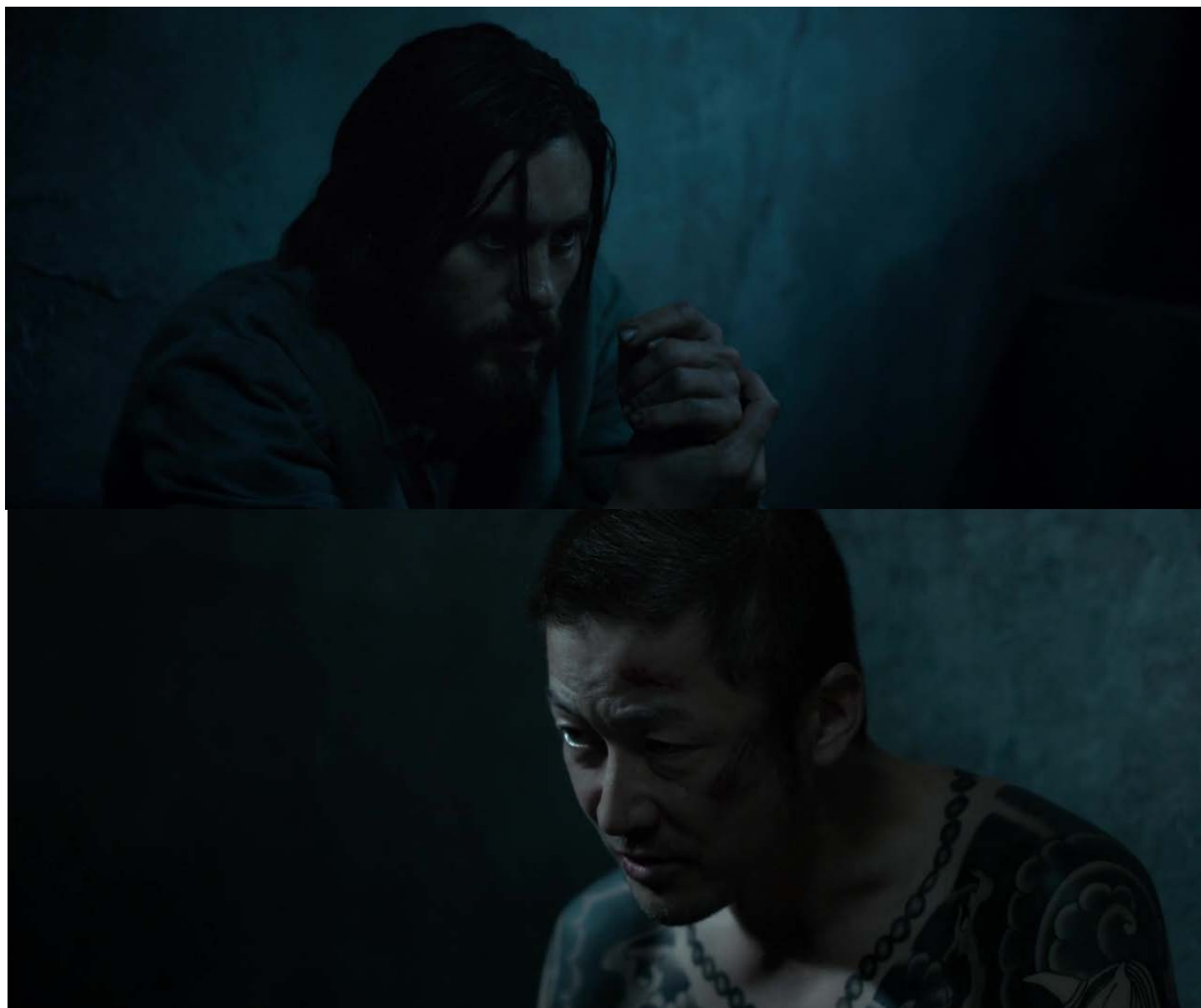
Nick és Kiyoshi a börtönben