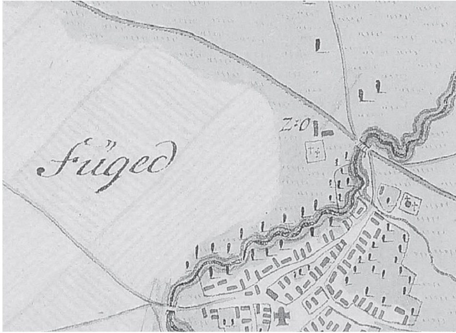
Nagyfüged első katonai felmérése (részlet) 135

1785. augusztus 22-én a király kiadta a Nagyfüged jobbágy lakosainak számára is oly fontos jobbágyrendeletét. 136 Ebben megszüntette a „jobbágy” szó használatát, és biztosította a szabadköltözést. Továbbá a rendelet kimondta még, hogy a paraszt szabadon házasodhatott, rendelkezhetett az ingóságaival és a telkéről törvénytelenül nem lehetett elüldözni. 137 Ezekből azonban semmit sem tapasztalt Kitaibel Pál, aki a falun átutazott 1803. május 1-én és a következőt látta „Fügednek igen sok földesura van. A parasztokat nagyon nyúzzák, egynek gyakran három földesura is van! Áthaladtunk a Tarnán, ahol egy csárda, egy fürdőház és nem messze egy malom áll a folyón. 138 Bal kézre pár tölgyliget, amelyek lombját a hernyók teljesen lerágták.” 139 Az idézet ellenére a többi forrás alapján úgy vélelmezhető, hogy a falu fejlődési rátája pozitív irányba mutatott és a település fontos szerepet töltött be a környéken.