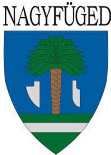
Nagyfüged címere 123

Feltételezhetően Mária Terézia utolsó uralkodói évében 1780-ban születhetett meg a falu pecsétje és a pecséten lévő kép lett a későbbiek folyamán a falu címere. Ez a következőképpen nézett ki: földből kinövő fügefafa, mellette ekevas illetve csoroszllya és iga, továbbá mindkét oldalon búzafüzér.