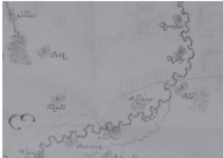
Nagyfüged a Jászkunok birtokaként 1731-ben (részlet) 11

Az Árpád-kortól több birtokosa is volt Fügednek, egészen Zsigmond király uralkodásáig, amikor is a birtok a koronára szállt vissza. Az uralkodó idején a magánbirtokok előretörésével Nagyfüged 1427-ben a Jászkunok birtokká vált egészen a török hódításig. 10