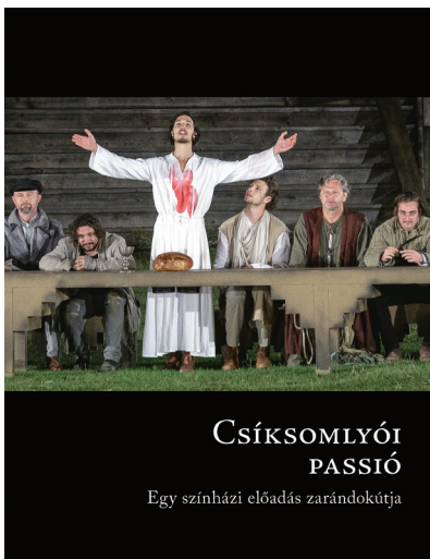
Csíksomlyói passió MMA Kiadó, 2018, 224 oldal, 4800 Ft

Ha Csíksomlyóról szó esett, néhány évtizeddel ezelőtt az irodalomban járatos polgárnak Tamási Áron furfangos székye legénye ugorhatott az emlékezetébe: „azért vannak a barátok, hogy helyrehozzák nap nap után, amit az ördög elrontott.” Mostantól a kultikus helyet egy emlékezetes kiadvány örökíti meg: a Csíksomlyói passió összefoglaló címen ismert monumentális szabadtéri előadás súlyos, képi és szöveges emlékezetét rögzíti oly módon, hogy egyszerre a vallási, a nemzeti és iskolatörténeti hagyományok, kultúránk horizontján a néptánc, -dal, -költészet és színjátszás egymásba épülését is megrajzolja. A két Somlyó-hegy közti Nyeregben megvalósult egyszeri esemény legfőbb létrehozói részben él-ményeikről vallanak, részben szakmai magyarázatokkal egészítik ki a kiváltságos alkalommal óriási méretűre növelt és a tájba szervesült színpad látványosságait. (Szükség is van értelmezésre, mert aki csak a Duna TV adását követte, keveset foghatott fel a látvány bonyolult összetettségéből.)