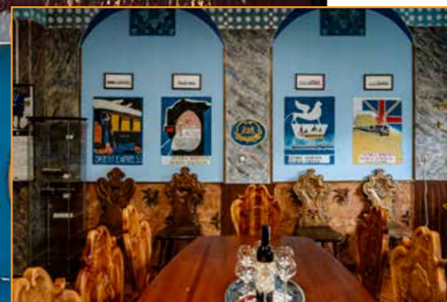
Hihetetlen, hogy egy kis épületben hogyan fér el megannyi látóvaló és meglepetés.