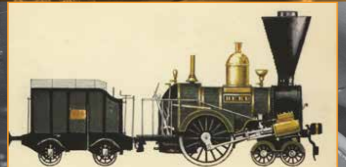
A Derű ábrázolásai közül a második családja, a mozdony ugyanis soha nem közlekedett valódi pályán mivel csak modellként létezett

A magyar gyártmányú gőzösök java méltán vált a hazai ipar büszkeségévé és szerzett nemzetközi hírnevet. A legendás járművek mellett azonban érdemes megemlékezni az első hazai gyártású mozdonyról is, amely valójában egy modell volt, mégis működése alapján teljes értékű vasúti járműnek tekinthető.