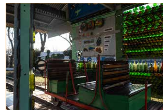
Ráfli Imre terve alapján elkészült a 6 személyes kézi hajtány, ami az idelátogató gyerekek kedvence.