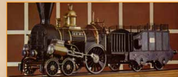
A modell a Közlekedési Múzeum régi kiállításán

Nagy Lajos és Nagy Gergely tehát nem elsősorban a vasút iránti elkötelezettségből kezdett építeni. Mozdonyukat afféle vizsgamunkának szánták, ezzel bizonyítván tehetségüket, és abban bízva, hogy így felhívhatják magukra a figyelmet, és sikerül annyi pénzt összegyűjteniük, amely elegendő lehet a műegyetemi oktatás költségeinek fedezésére. A munkát 1845 júniusában kezdték, de mivel a gyárban ezt az ötletüket sem pártfogolták, csak kevés szabadidőjükben dolgozhattak a mozdonyon