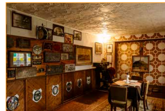
Az egykori garázshelyiség ma egyedi vendégfogadó hely.