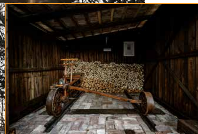
Az egyik legkülönlegesebb darab ez a több mint 100 éves, fából készült, eredeti hajtány. Ilyen típusú hajtányok később fémmel készültek és csővázások voltak.