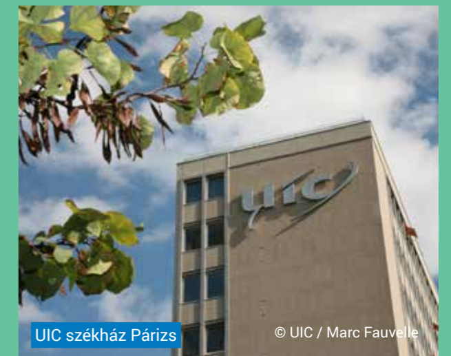
UIC székház Párizs

Munkájuk másik fontos területe az utaztatás: előkészítik a MÁV és a MÁV-START külföldi kiküldetéseit, a szerződött utazási irodák útján szerzik be a repülőjegyeket, biztosítják a valutaelőleget, utasbiztosítást, gondoskodnak a kiutazók folyamatos és gondos tájékoztatásáról, valamint a pénzügyi elszámolásról.