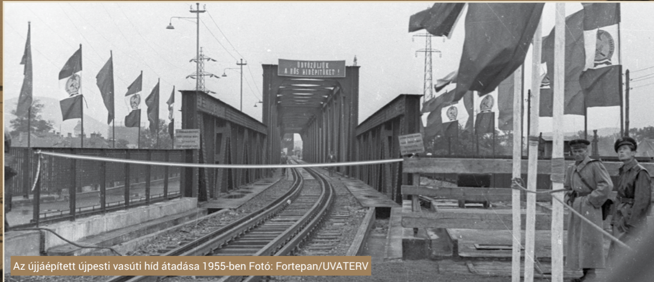
Az újjáépített újpesti vasúti híd átadása 1955-ben.

Pár évvel ezelőtt került napirendre ismét a budapesti körvasút ügye, ezt azonban a főváros adottságai miatt nem valamiféle szabályos köralakzatnak kell elképzelni. A legutolsó tervek szerint a régi/új vonal Óbudától indulva Angyalföld, Zugló, Pestújhely, Rákosszentmihály, Kőbánya és Ferencváros érintésével érkezne Kelenföldre, azaz a kör nem zárulna be teljesen. Pedig korábban volt erre is példa.