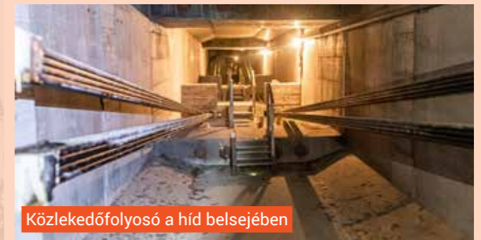
Közlekedőfolyosó a híd belsejében

A nagy völgyhíd közvetlen szomszédságában helyezkedik el a Balla-hegyi alagút, amely nevét nem hivatalosan Göntér Mária Zsuzsannáról, Göncz Árpád volt köztársasági elnök feleségéről kapta. Az alagút fúrása során a napi fejtés átlagosan 2,5–3 méter volt, 40 centiméteres héjszerkezete kétsoros acélhálóból és lött betonból épül fel. A fölötté lévő földtakarás 2 méter-től 12 méterig terjed.