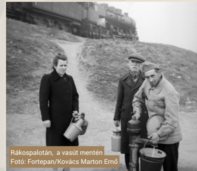
Rákospalotán, a vasút mentén

közös használatban ún. peage-vonalként tudták igénybe venni. Minden bizonnyal ez a lóvasúti közösködés is hozzájárult ahhoz, hogy a forgalmat kizárólag az éjszakai órákban bonyolíthatták a tehervonatok. Mai szemmel úgy tűnik, hogy a körvasút pályája a Margit körutat elhagyva a szentendrei HÉV vonalához csatlakozott, ami igaz is annyi különbséggel, hogy a HÉV budapesti végállomása ekkor még a Filatorigátnál volt, vagyis a Margit hídig tartó szakaszt a MÁV építette. Vagyis az 1888-ban átadott szentendrei HÉV csak a körvasút megépítése után közlekedhetett (ugyancsak peage-vonalként) Szentendréről akkori új végállomására, a Pálffy (ma Bem József) térig.