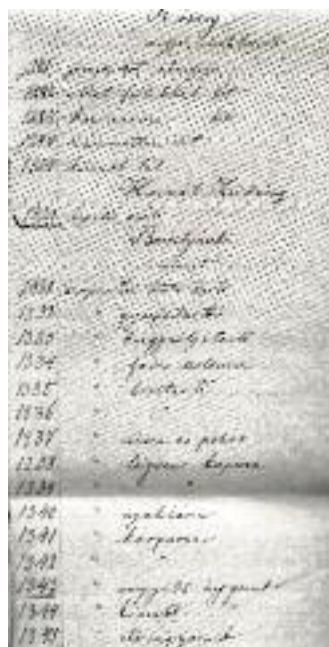
9. kép Nemzetiségekre utalás (Kőszeg, Horvát Zsidány, Borostyánkő, részlet)