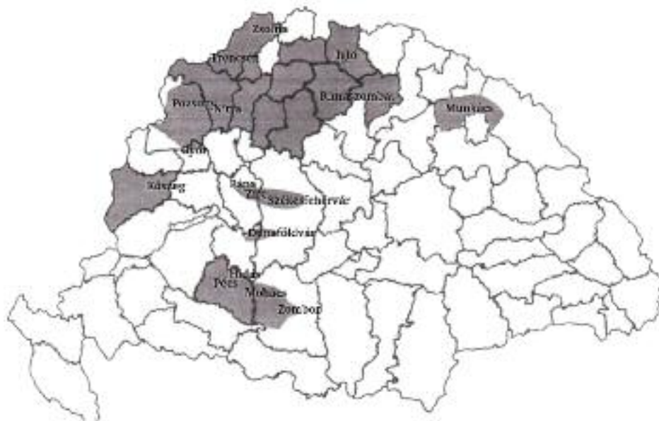
1. kép Rómer Flórián gyűjtési területe (a szerző szerkesztése)

Xántus János tervezete természetesen nem minden vonatkozásában valósult meg, de főbb vonalaiban és leglényegesebb elemeiben igen. Ez igazolni látszik Xántus szakmai felkészültségét és gyakorlati érzékét. Különböző források és dokumentumok segítségével, több-kevesebb biztonsággal rekonstruálhatjuk az elvégzett