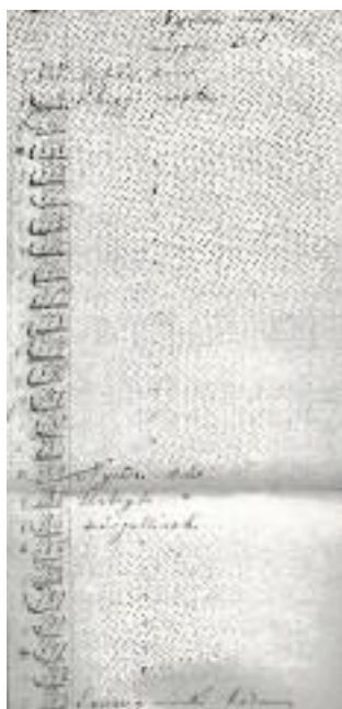
8. kép Nemzetiségekre való utalás (Nyitra vidéke)