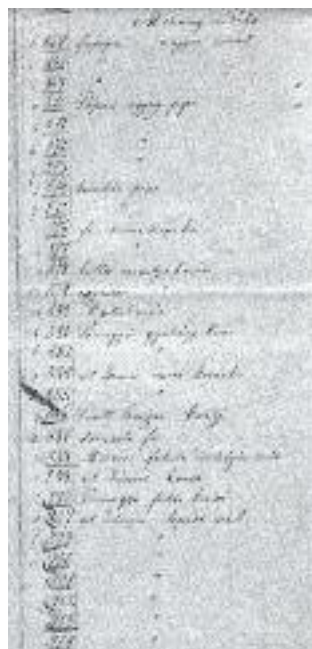
7. kép Gyűjtési hely általánosabb hely megjelöléssel (Mosony vidéke)