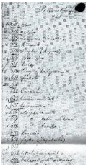
6. kép Gyűjtési hely településnévvel (Breznóbánya, részlet)