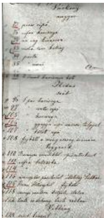
10. kép Gyűjtési hely megjelölés hiánya (Vegyesek)