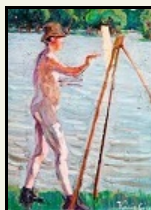
Kádár Géza festőművész