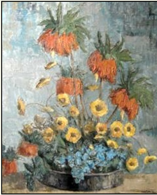
Kádár Géza: Virágcsokor.