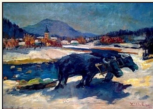
Kádár Géza: Ökrösfogat.

a rend, az új rend mindenek felett visszatért a maga szűk medrébe, zsarnokság van a zsarnokság helyett, csak ezt ma sokan nem veszik észre.