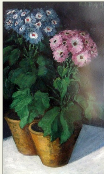
Kádár Géza: Virágok.