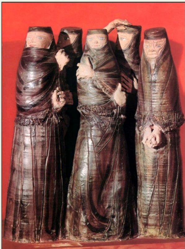
Kovács Margit: Halászsasszonyok.

Kis törpe fácška, te csak ragyogj a fényben, s birkózz, mikor a jégvihar dühöng, mikor tölgyek és jegenyék meghasadnak, téged ölel és megvéd az anyaföld... Belőle lettél, kicsinynek születél szélfútta magból, mint a végtelen változat itt a létező világban, mint az örök törvények szerinti Értelem!