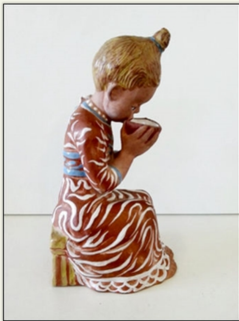
Kovács Margit: Tejivó lány.

Dólj vállamra! Ne ríj! Ne átkozz! Eresszük reszkető karunk a lábhoz. Elég temetned! Simíts búsongó engem, és ősi, öröktől érthető nyelven olvasd rám szent, asszonyi kegyelmed.