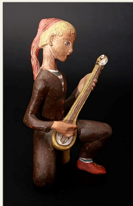
Kovács Margit: Mandolinós fiú.

tovább, tovább, hogy mindenkit elérjen, futótűzként fusson a föld körül: jönnek, jönnek a szabadító népek és minden rabkéz fegyvert köszörül... Vörös csillag ragyog az éjszakában, recseg a rács a börtönablakon... rabtársaim, fölsebzett ujjaimmal a szabadság hírét kopogtatom!