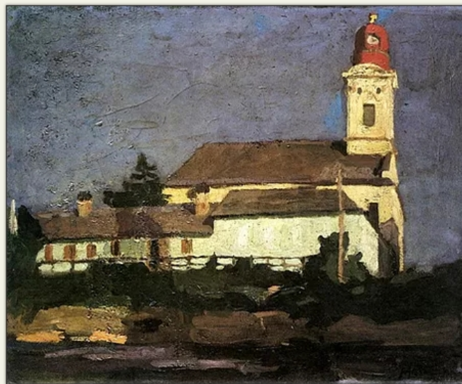
Maticska Jenő: Híd utcai református templom.