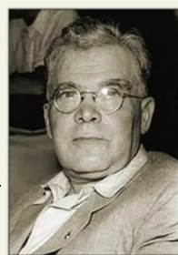
Gábor Andor HAZÁMHOZ (1942)

Körül sötét van, didereg a lélek, Szemem kutatja elveszett hazám, Mít látok ott, ha egyszer visszatérek, Hunyt életem óhajtott tavaszán? Magyar, magyar, a nevedet kiáltom, Hiszen vérem vagy, bárhogy is tagadd, Züllött szülém, piszokba hullt virágom, Hazám, nem ismerem meg arcodat!