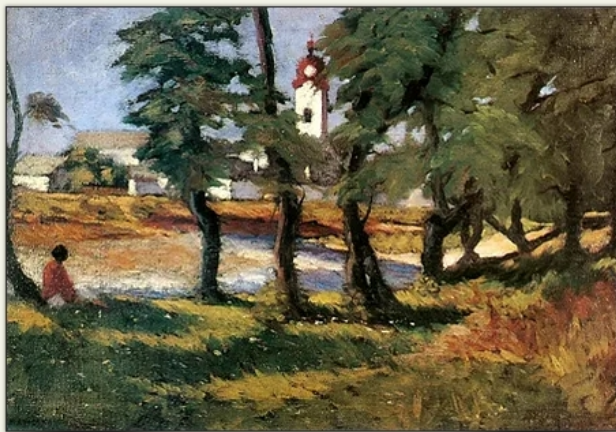
Maticska Jenő: Nagybányai táj.

Küszködven, sistergő parázként, Tűz ojtó, fojtó csúf idővel, Itt állok, nem tehetek másként, Szent szóval és hitvánv tüdővel.