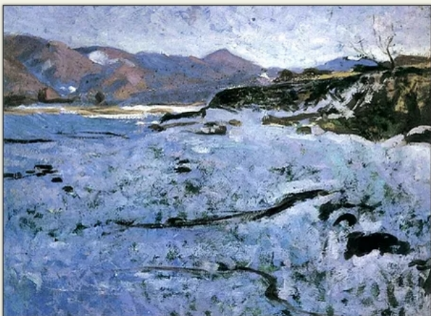
Maticska Jenő: Fagy