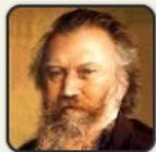
Brahms Symphony No.3 Alaegretto