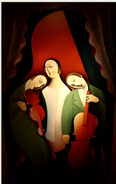
Kádár Béla: Trió.

Fekete fehér képeken mély sötétség a víz-elem a hajó test meg se mozdul a hajólánc mégis megcsikordul az emlékek óra-művein. Az ellenség a partokon les kamikazek készülődnek a béke hűlt helyin. Felszított lángok dideregnek kozmosz vibrálást vetnek a víz megtorpant fodraín. Egy szörnyű éjből mindent látott az örök végtelen látnok e tenger mélyre süllyedt világot már nem zavarja más csak a kormoránok.