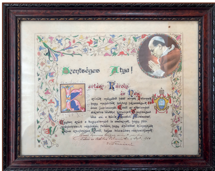
Pápai áldás az 50 éves házassági évfordulójukon

A család férfi tagjai délutánonként, ha idejük engedte, az „Úri Kaszinóba jártak, sakkoztak, kártyáztak, beszélgettek. Nagyapa nagyszerűen összefogta az embereket, a családot. Minden karácsonyt ott töltöttünk, sokszor két hétig is. Húsvétkor egész nap locsolkodni