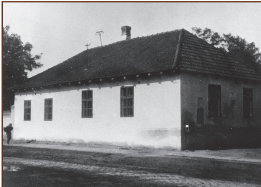
Szentkúti Iskola a Kovács (ma Kossuth) utca és a Mária utca sarkán