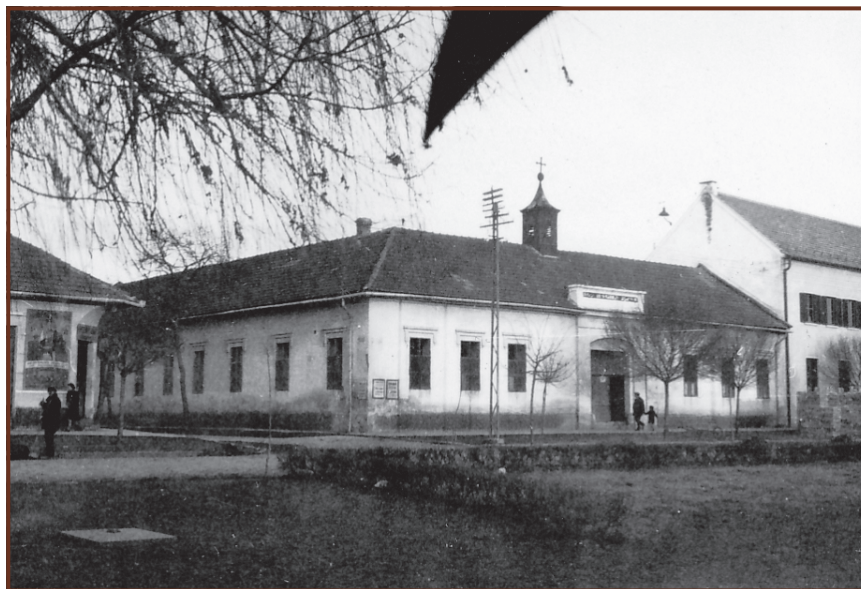
Az 1938-ban lebontott Központi Elemi Népisiskola épülete a Főtéren

Az egri tanítóképző középfokú intézmény volt, hiszen „az egész országban az elemi (általános) iskolák alsó tagozatának tanítóit középfokú intézményekben képezték, tehát a diákok többnyire 15 éves koruk körül kezdtek itt meg tanulmányaikat” – olvasható a tanító-