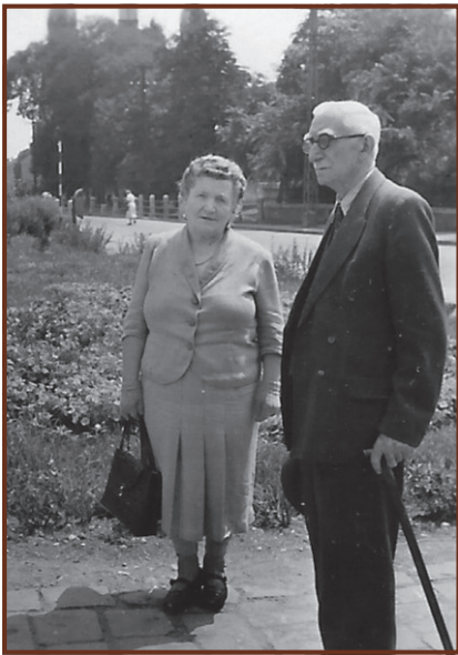
1957 júliusában Miskolcon, feleségével

Néhány nyugdíjas hónap után a kántortanító örökre elhagyta a földi létet, a jászberényi Szent Imre temető családi sírhelyén pihen több rokonával együtt.