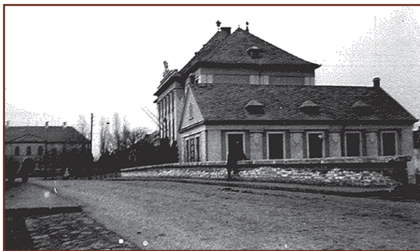
A kunszentmiklói öreg híd

Történetéről mégis inkább a kunok II. István és IV. Béla idején történő letelepedéséről vallanak a levéltári adatok. A török megszállás után a város építésének fellendülése az 1745-ös redemptióval volt párhuzamos.