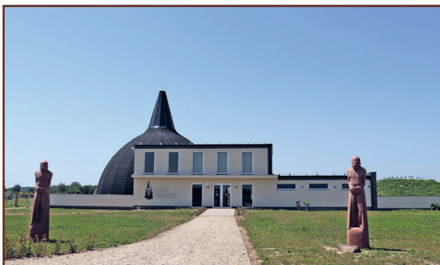
Harminchárom kiskun település emlékhelye Szankon