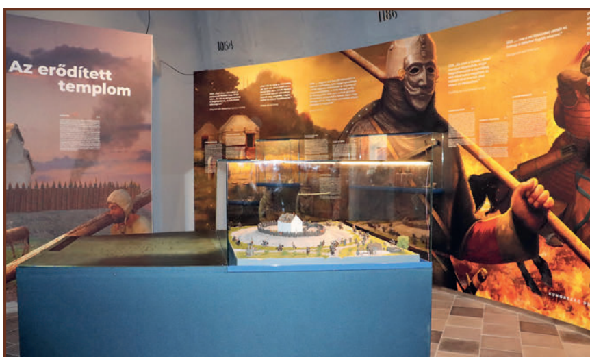
Kiskun emlékhely – A kiállítás részlete