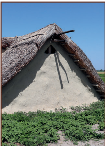
Árpád-kori veremház