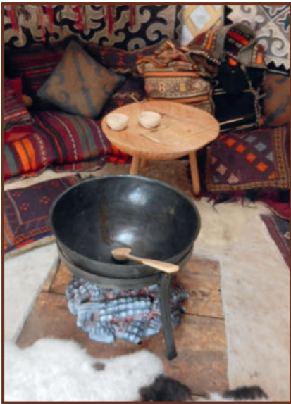
Részlet a jurtából.