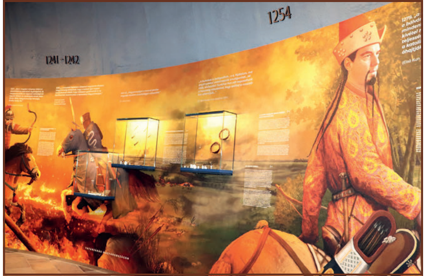
A kiállítás részlete.